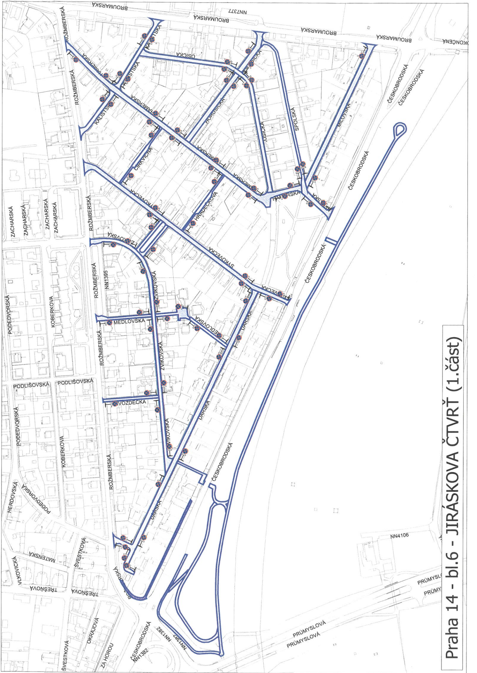
Praha 14 - bl.6 - JIRÁSKOVA ČTVRTĚ (1.část)