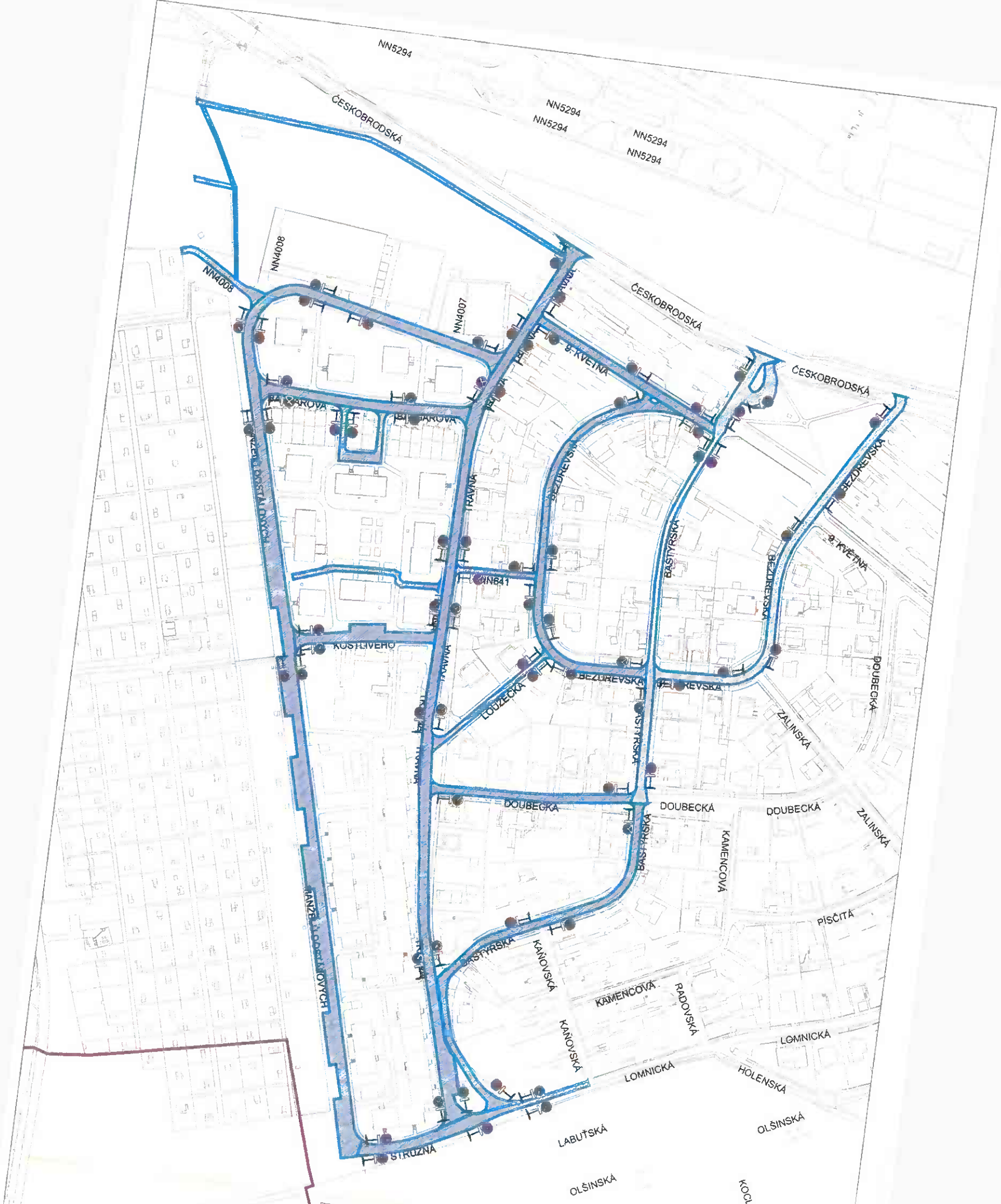
Praha 14 - bl.5 - JAHODNICE (1.část)