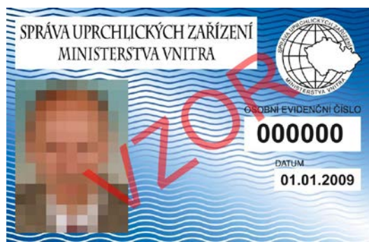
12. zaměstnanec Správy uprchlických zařízení MV