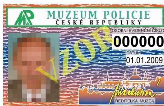
10. zaměstnanec Muzea policie ČR