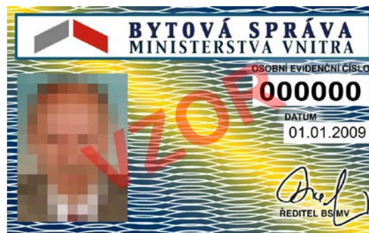
8. zaměstnanec Bytové správy MV