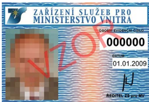
7. zaměstnanec Zařízení služeb pro MV