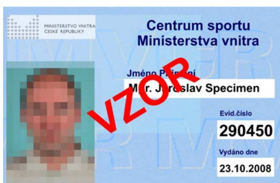
9. zaměstnanec Centra sportu MV