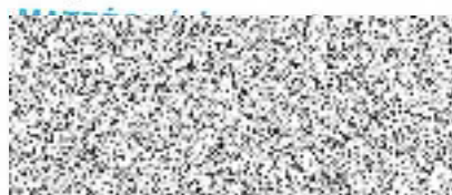
Dana Pechová - ředitelka