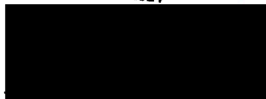
gr. Jan Konvalinka starosta města Příbram