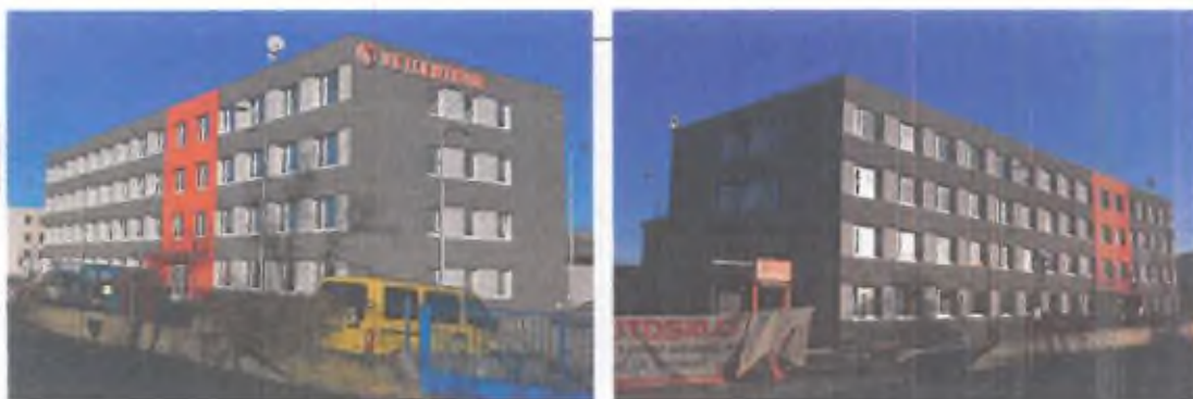
Pohled na budovu z přístupové komunikace