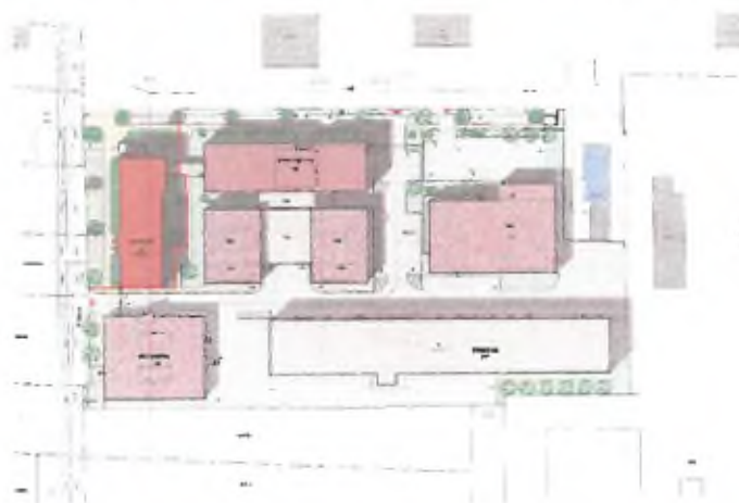
Velikost pozemku související s budovou obytnou: 1900m 2