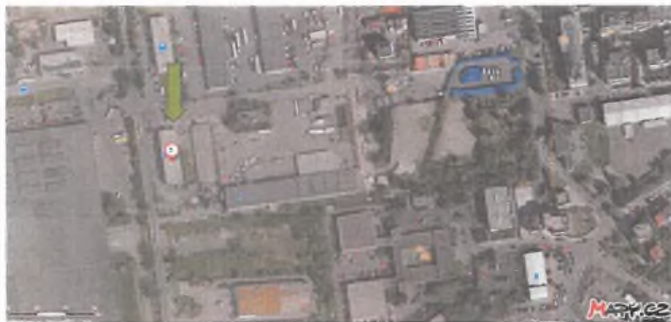
Umístění objektu v rámci areálu.