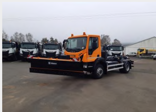
Model ML110E25W 4x4