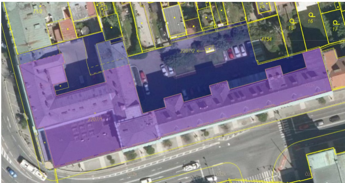
Obr. 1 – vyznačení řešeného objektu v katastrální situaci

Budova je zděná, čtyři nadzemní podlaží a jedno podzemní podlaží.