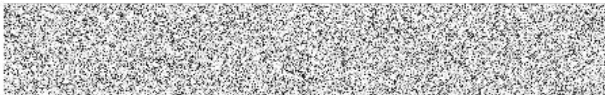
Mgr. Petr Vrána Starosta města Tachov