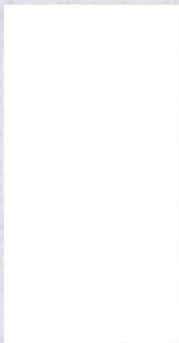
Karta MultiSport FKSP