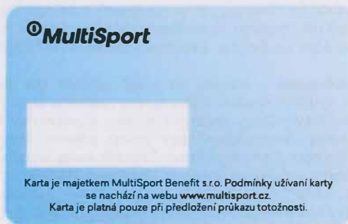
karta MultiSport Student