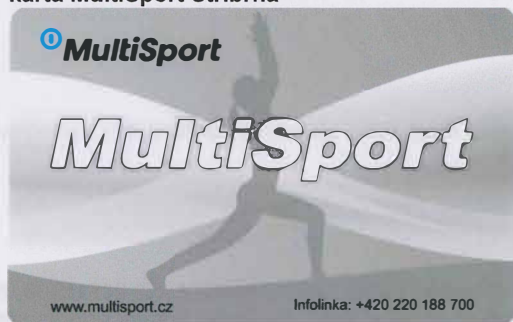
karta MultiSport Stříbrná