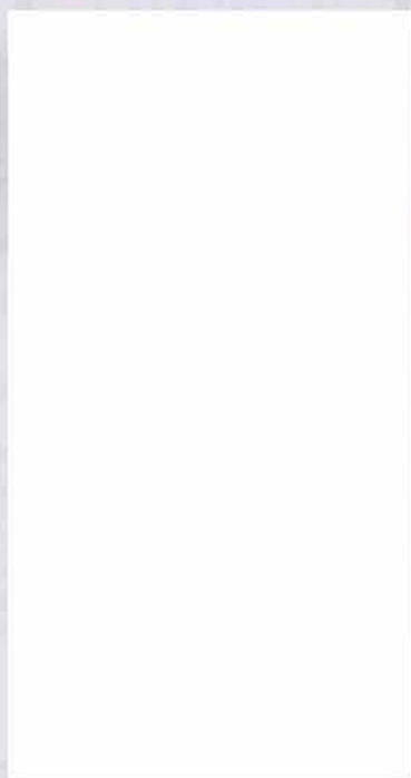
Karta MultiSport Stříbrná