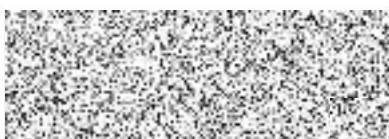
Bc. Robert Zelenka starosta města Blovice