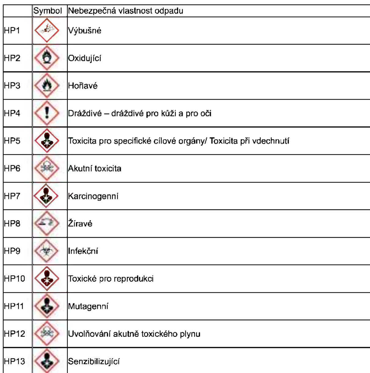
Tab. 1: Nebezpečné vlastnosti odpadů