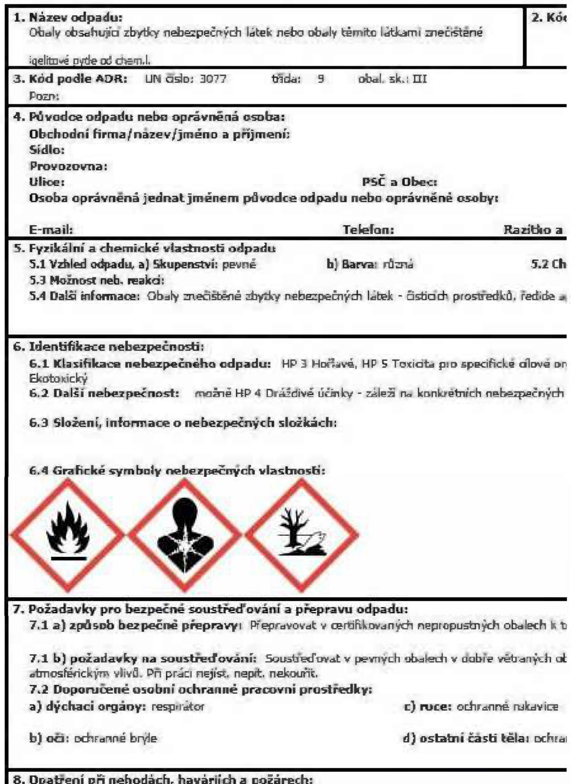
Obr. 2: Vzor identifikačního listu nebezpečného odpadu