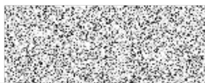
Římskokatolická farnost – děkanství Humpolec