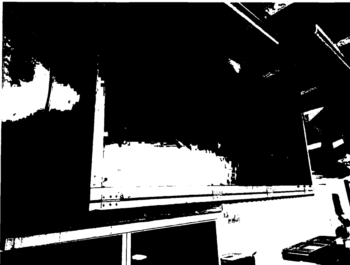
Obrázek 7Větrací jednotka