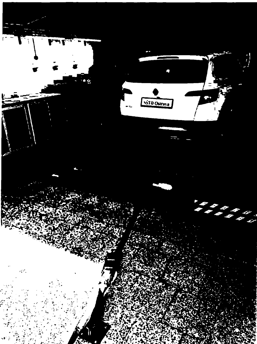
Obrázek 5 Upevňovací popruhy