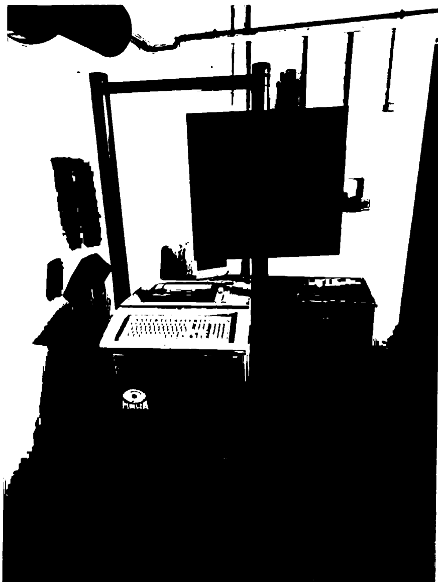
Obrazek 2 Komunikační pult