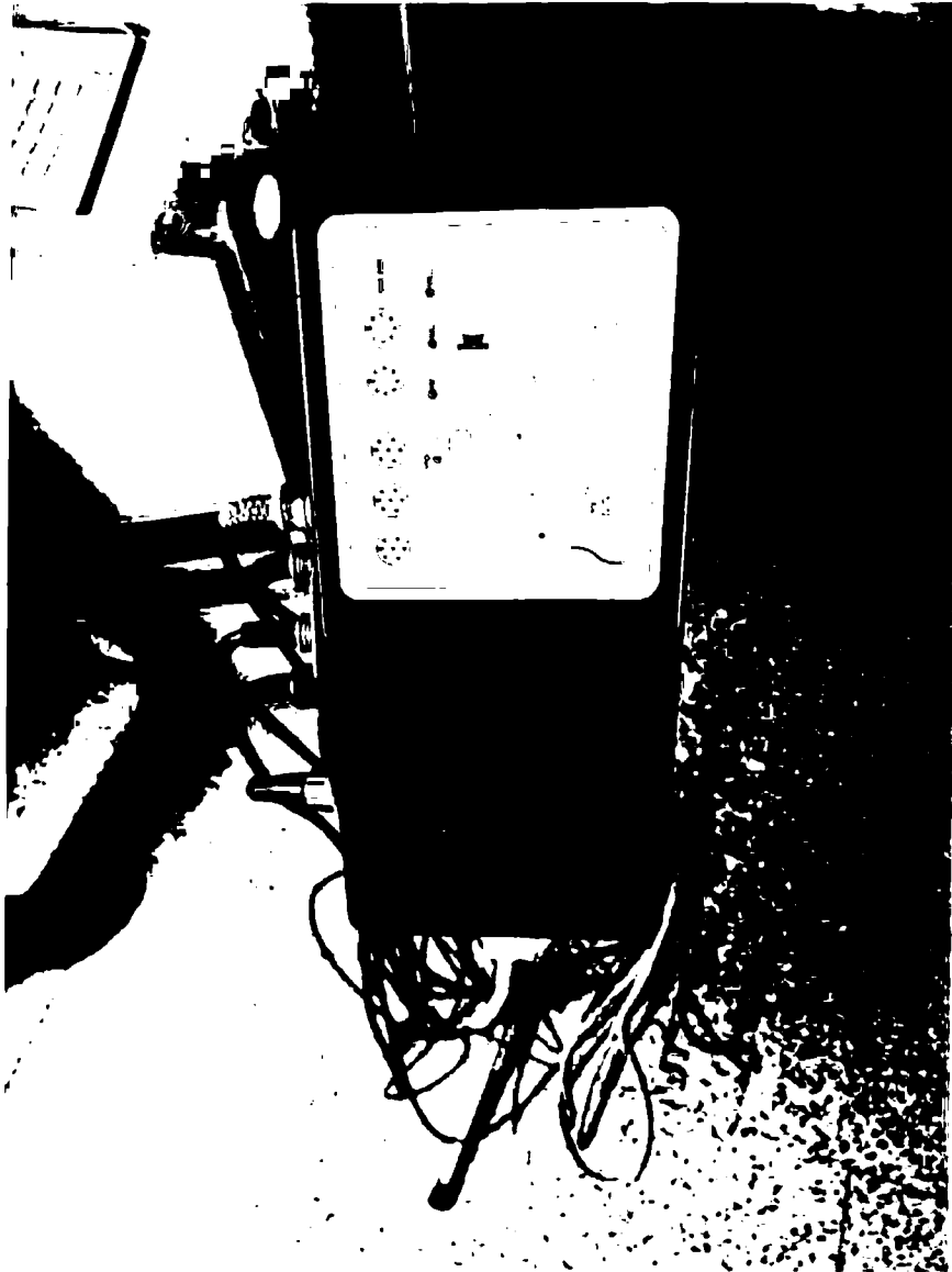
Obrázek 4 Směšovací box