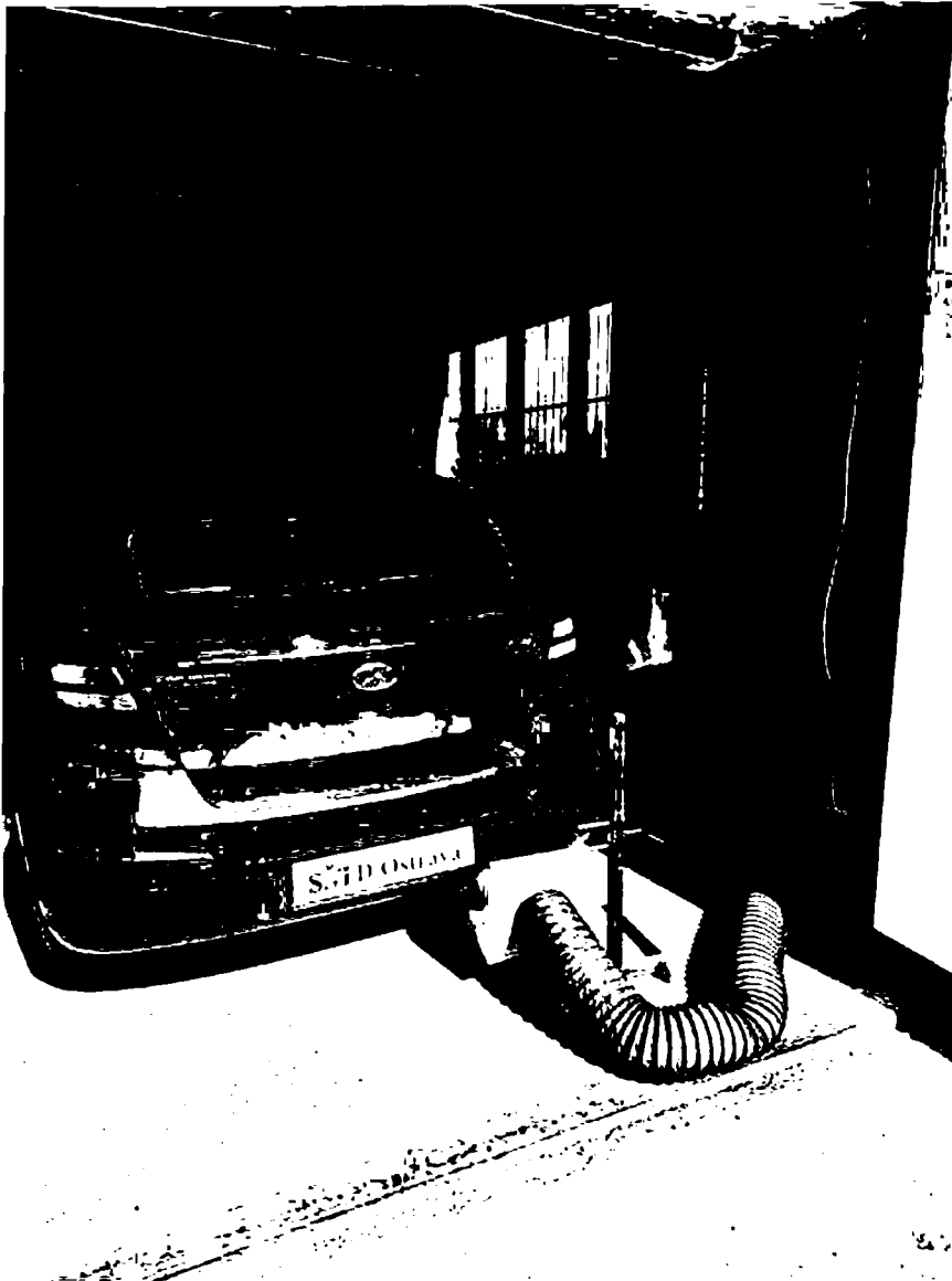
Obrázek 30tah spalin