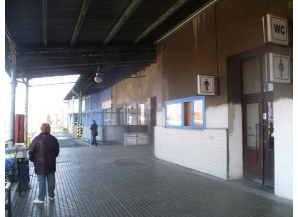
Vstup na veřejné WC