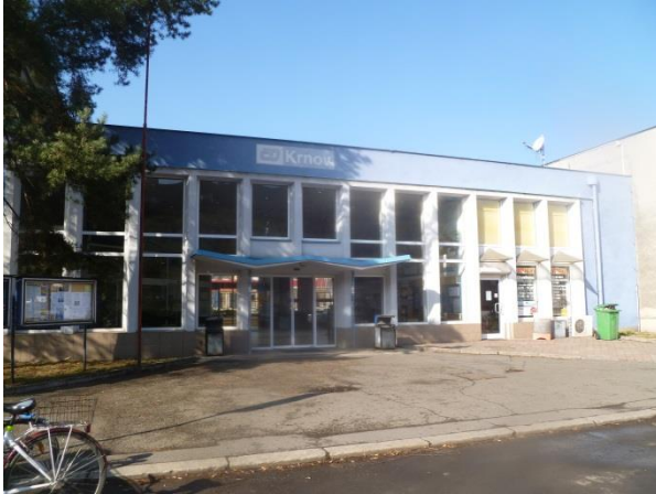
Pohled z ulice Nádražní