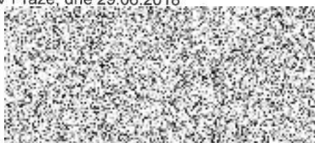
Razítko a podpis dodavatele