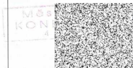
Ing. Michal Obrusník Starosta města Konice