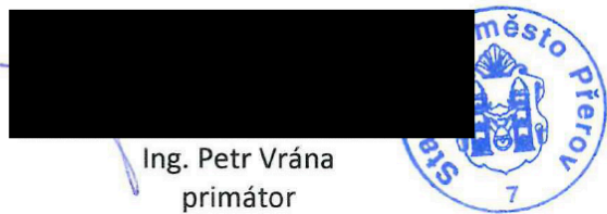
Ing. Petr Vrána primátor statutární město Přerov poskytovatel