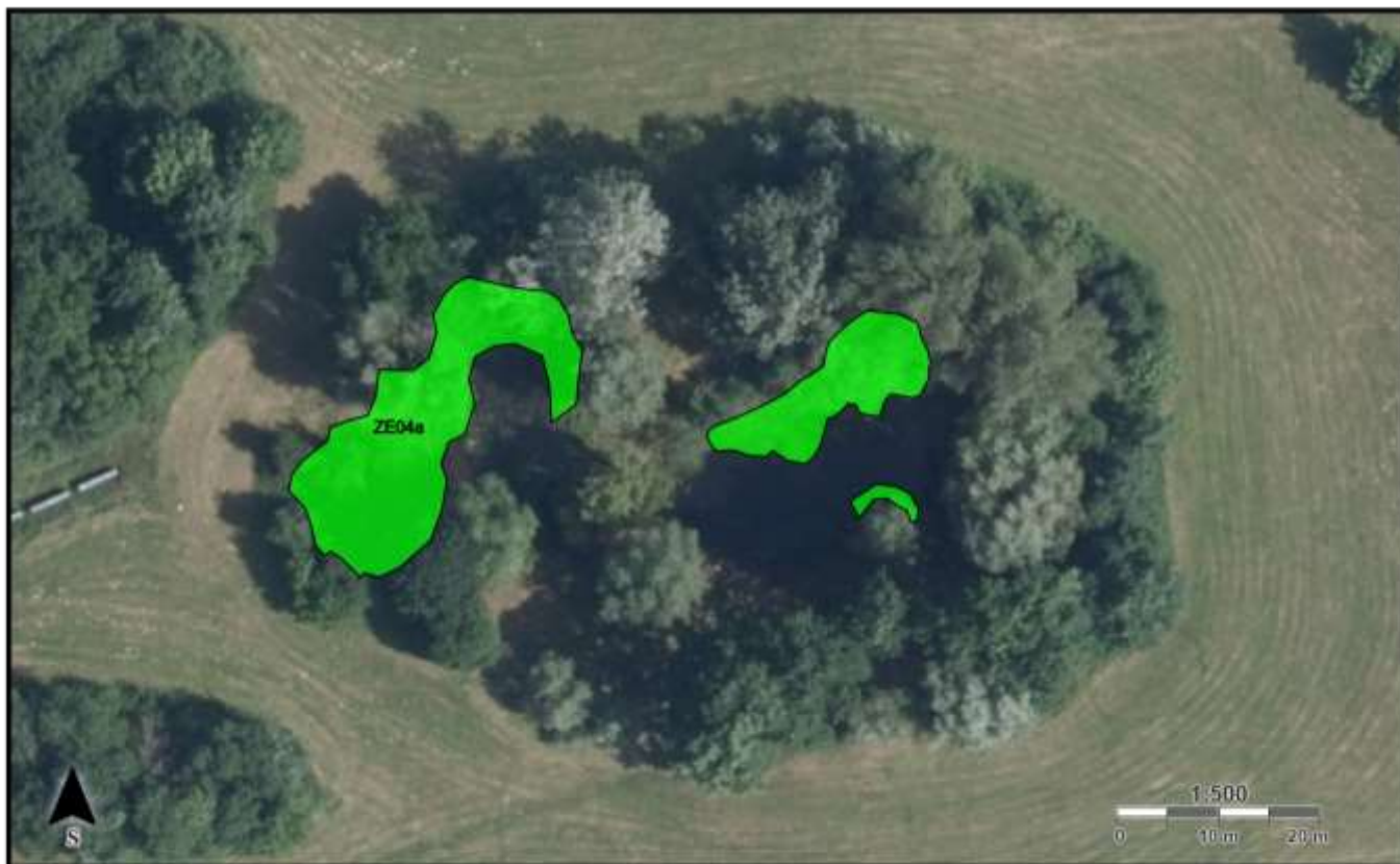
1326 [ZE04] Kácení volné [ZE04b] Kácení volné, průměr kmene na pařezu 21-30 cm