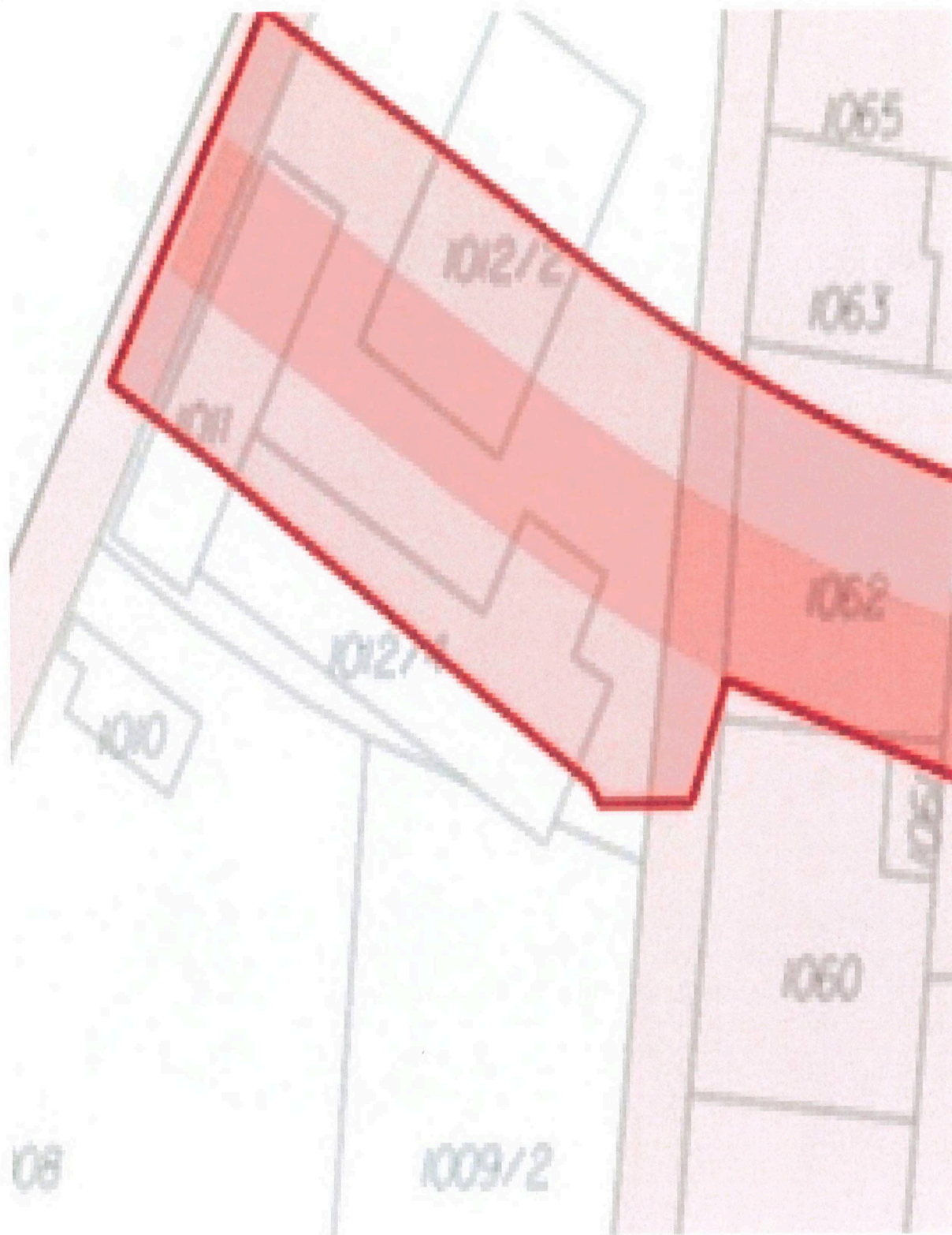
Příloha č. 3: Situační výkres předpokládaného trvalého záboru pozemků ČD