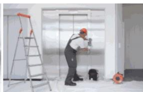
Servis 24 hodin