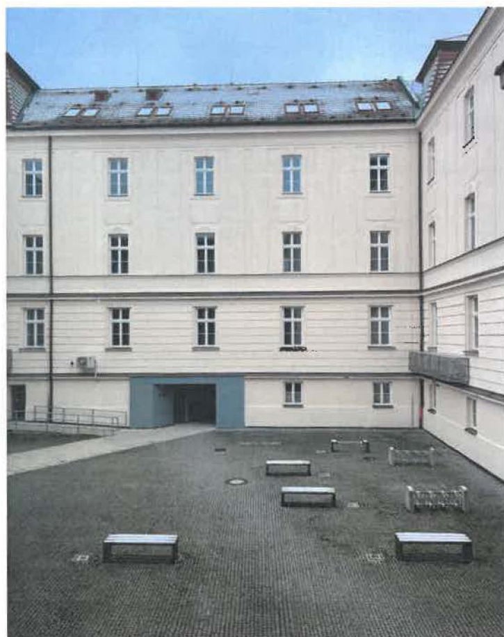
4. vnitroblok univerzity