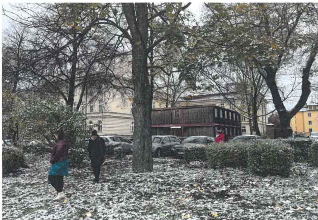
3. spojení s parkem a studií Parku Joy Adamsonové