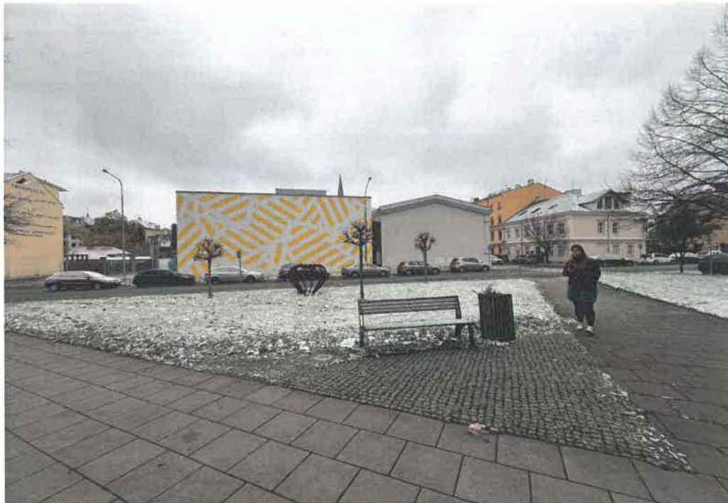
5. Veřejný prostor univerzity