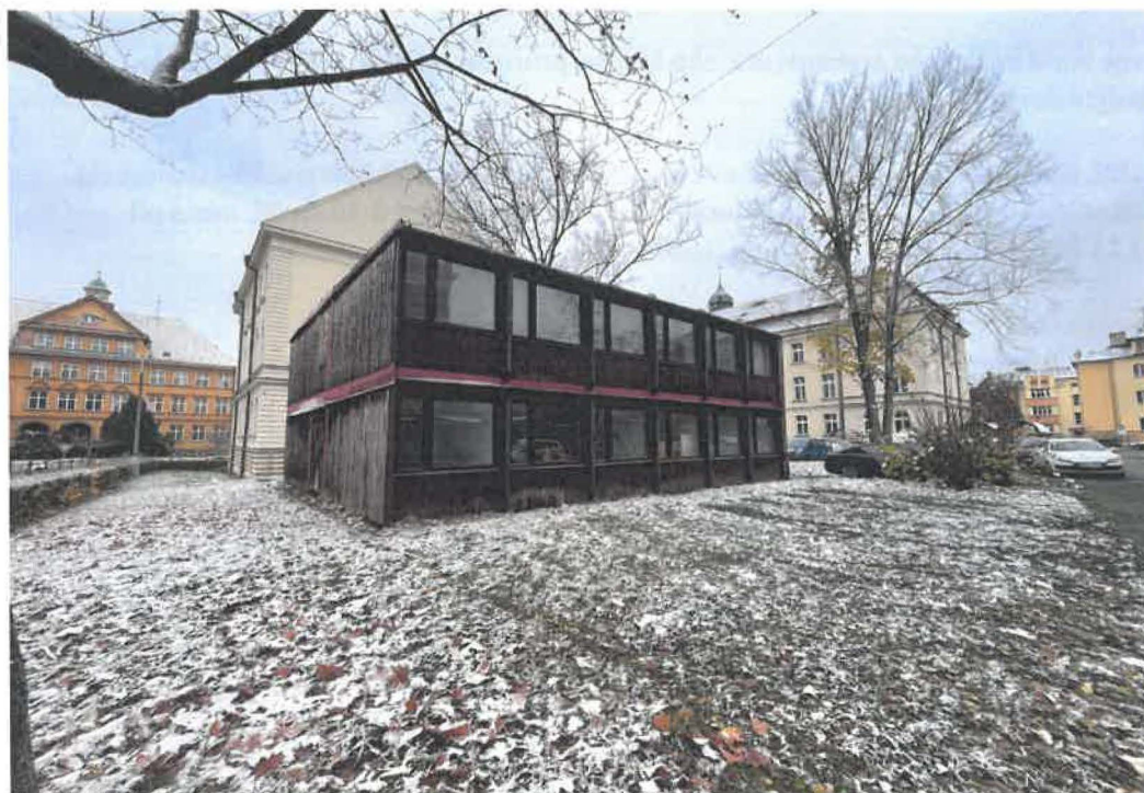
2. Současný vnitroblok, nová vize objektu