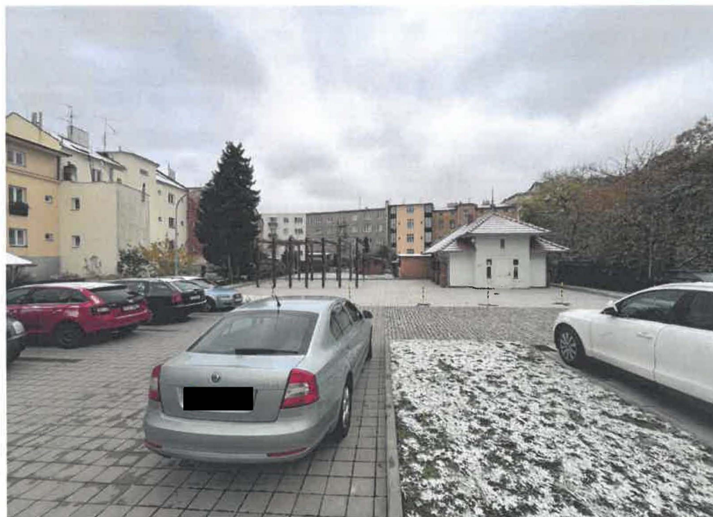
6. Sjednoceni veřejného prostoru univerzity