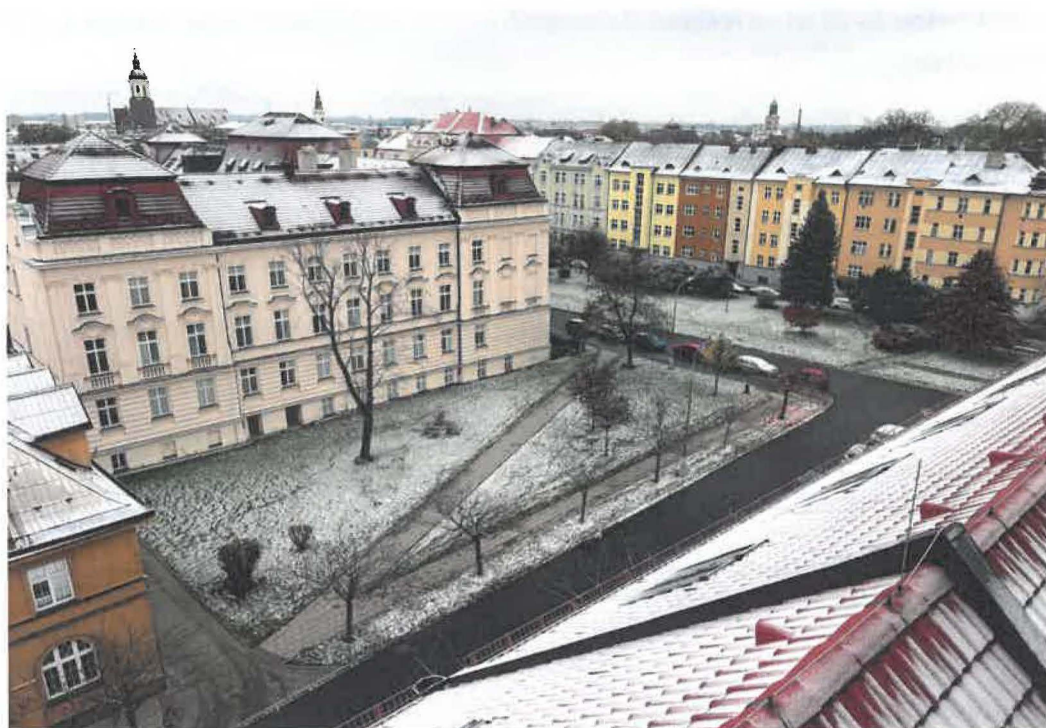
1. Veřejný prostor univerzity

Architektonická vize a architektonicko-urbanistická studie nových budoucích objektů Slezské Univerzity v Opavě.