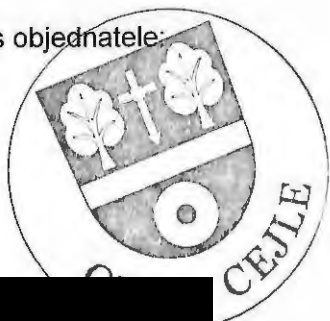
[Redacted signature] Pavčina Nováková starostka