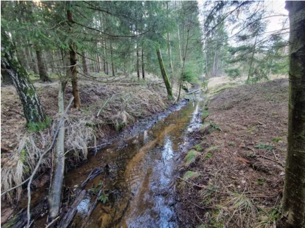
Obr. 3. Alternativní měrné místo 1 – pod rybníkem Horní Kracle; cca 100 m pod místem 1