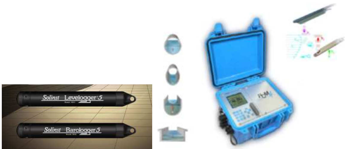
Obr. 4. Vlevo sonda Solinst Barologger / Levelogger; vpravo přenosná měřicí souprava NIVUS PCM 4