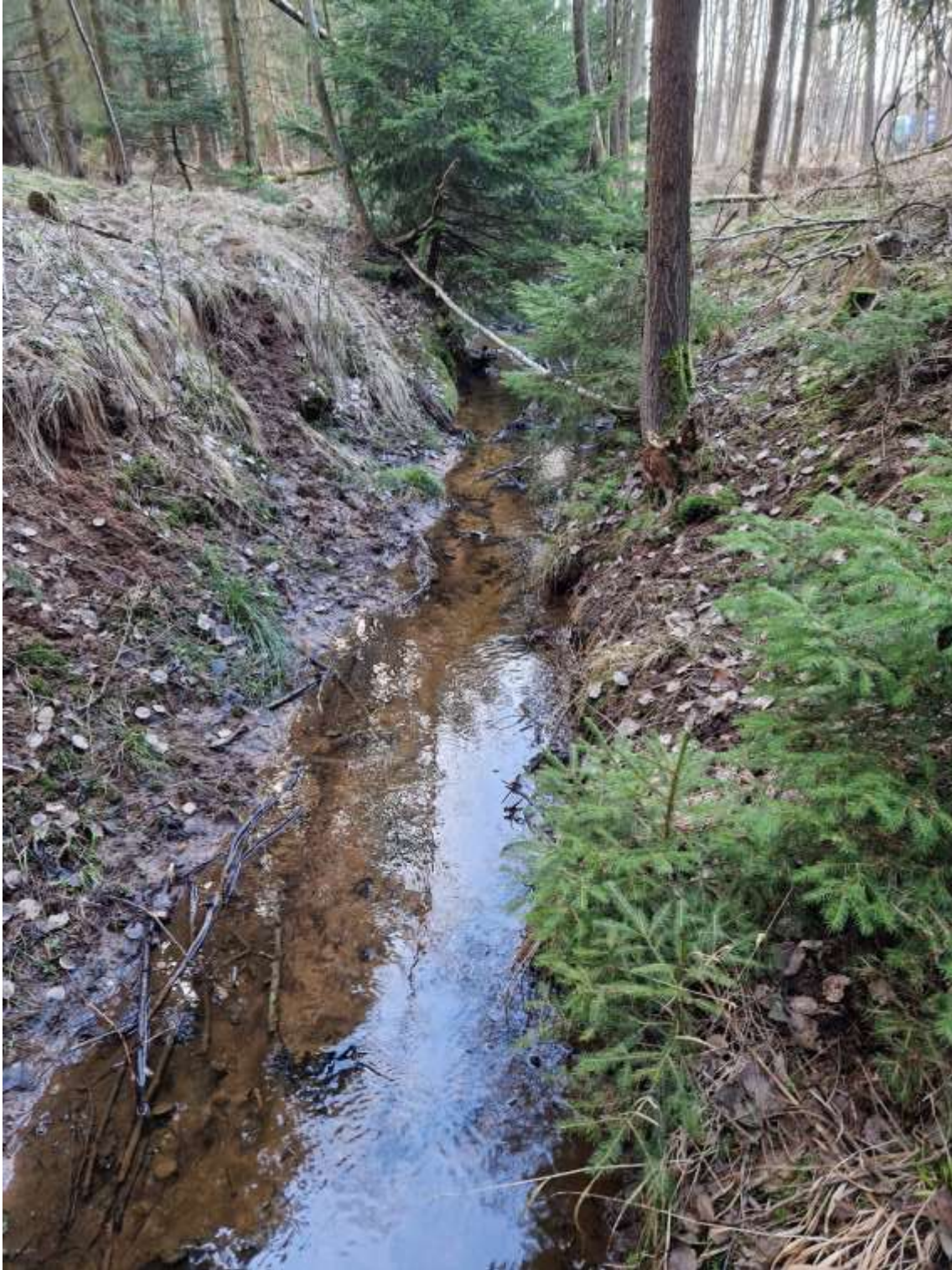
Obr. 2. Navržené měrné místo 1 – pod rybníkem Horní Kracle (50.1389853 N, 13.8477575E)