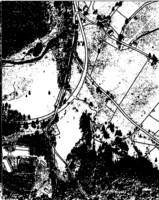
Stožec likvidace lupiny mnohohlístě k.ú. Stožec