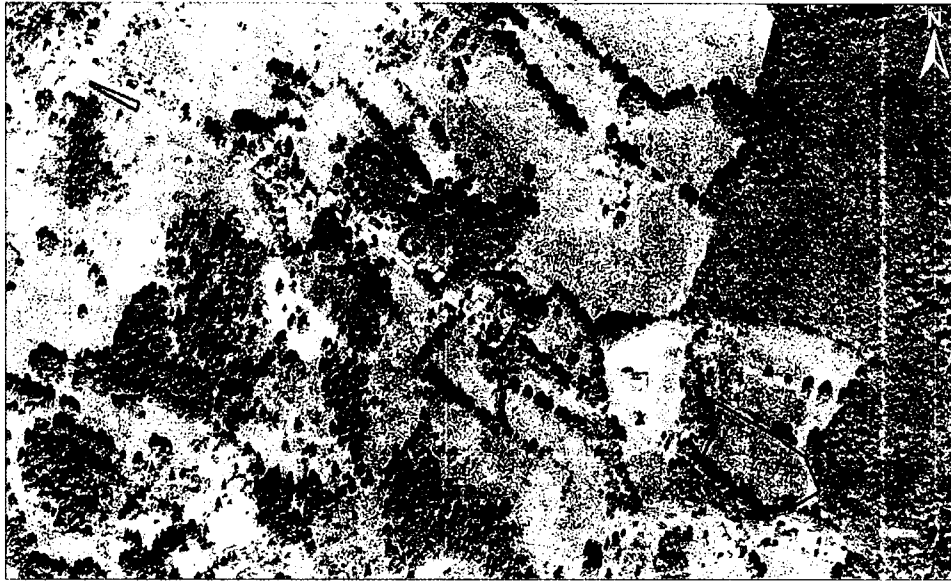
České Žleby - obec likvidace lupiny mnoholisté k.ú. České Žleby

Maximální stanovená cena: 220 089,00 Kč bez DPH