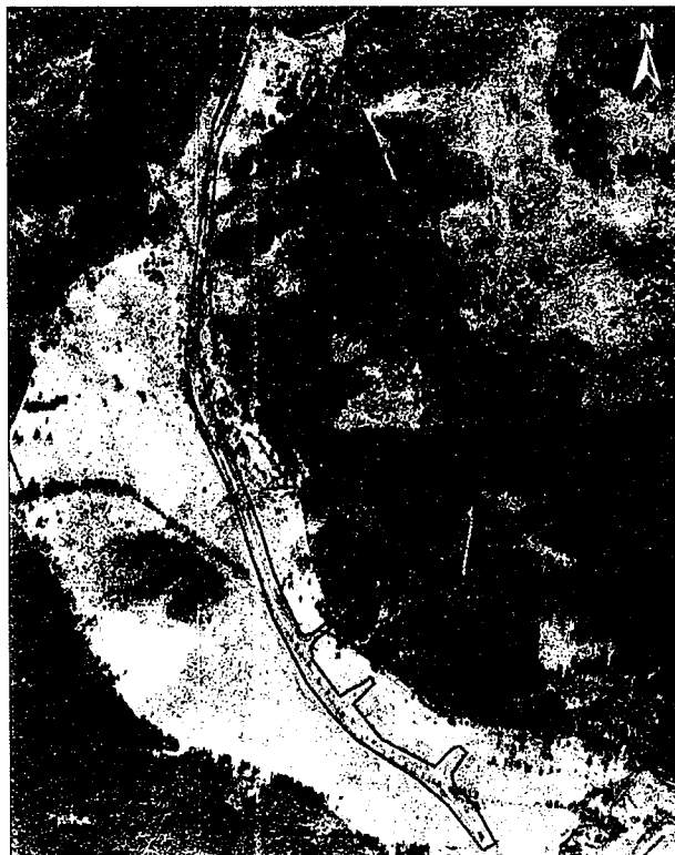
Stožecká luka likvidace lupiny mnohohlístě k.ú. České Zieby