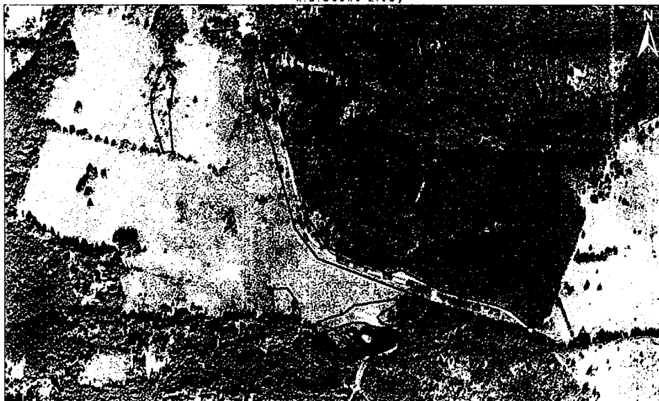
České Žleby - u rybníčku likvidace lupiny mnoholisté k.ú. České Žleby