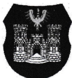
Město Český Těšín