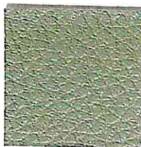
-Amade 013 32 020