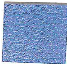
-Lavande 013 32 009

Calounění sedaku - potah koženka GINKO odstín LAVANDE 013 32 009 ISO 5470-2 Abraison Martindale 150 00 cycles váha : 830g / m2 Nehořlavá EN1021.1-2-3.EN 13501-1. Antibakteriální