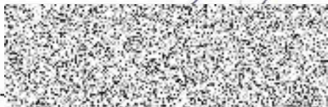
Petr Kašparovský starosta města