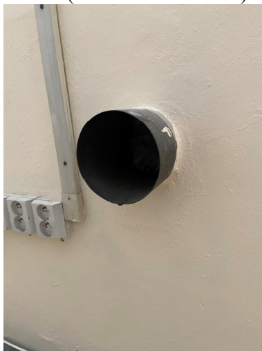
Potrubí k demontáži a zazdění

V místnosti 343 e: nátěr radiátorů Kalor, 20 a 30 čl. 500/160 demontáž elektroinstalačních lišt 110 x 60 mm, délka 14 m. Demontáž potrubí ve zdi průměr 140 mm a zazdění vzniklého otvoru (hloubka cca 40 cm)