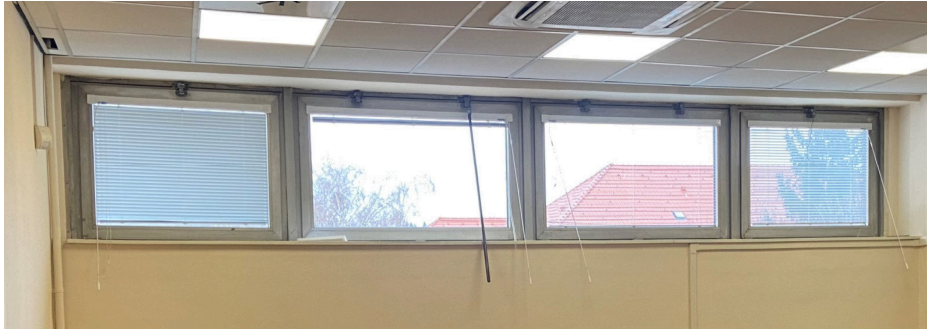
Okna se žaluziemi

Demontáž starých poškozených žaluzií 8 ks. Dodání a montáž 8 ks nových horizontálních žaluzií o rozměru: šířka 124 cm, délka 64 cm do hliníkových oken. Délka ovládání 120 cm. Místnost 343c a 343e.