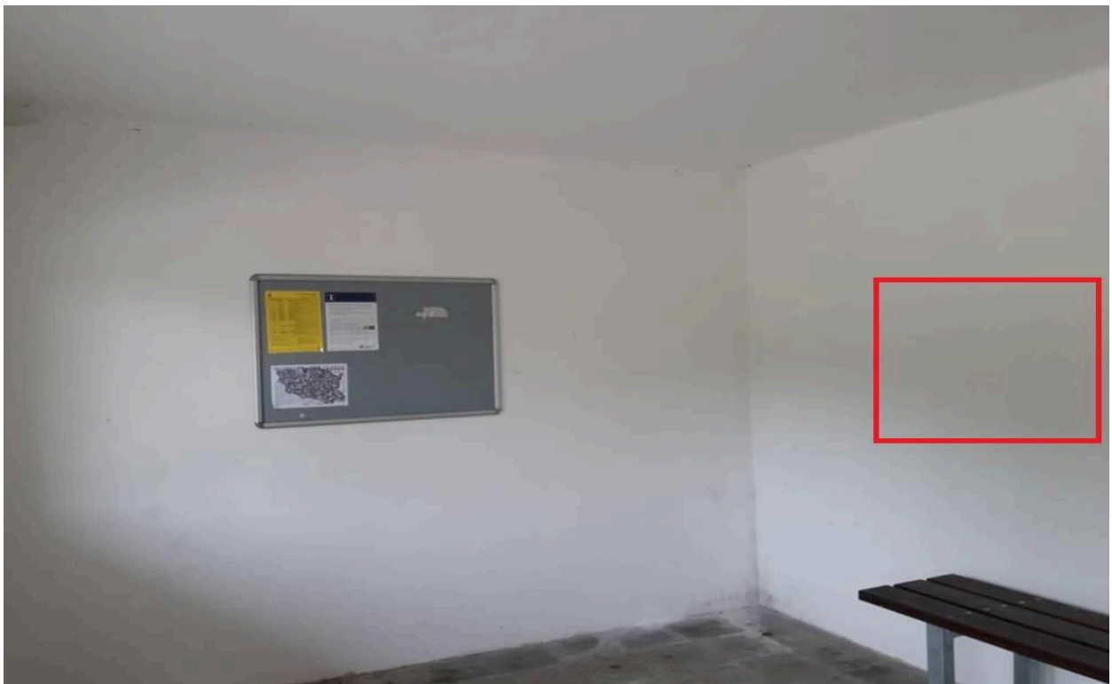
Zastávka Hnátnice (čekárna)