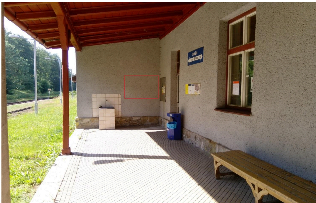
Výpravní budova žst. Bílá Voda (nástupní prostory)