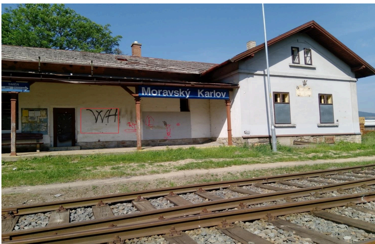
Žst. Moravský Karlov (nástupní prostory)