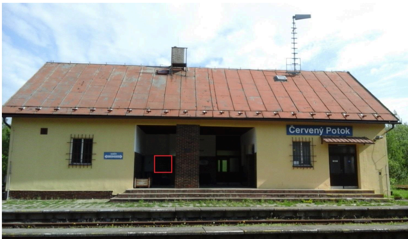
Žst. Červený Potok (nástupní prostory)