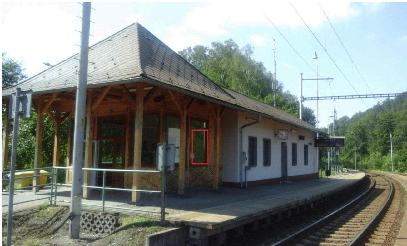
Žst. Těchonín (nástupní prostory)