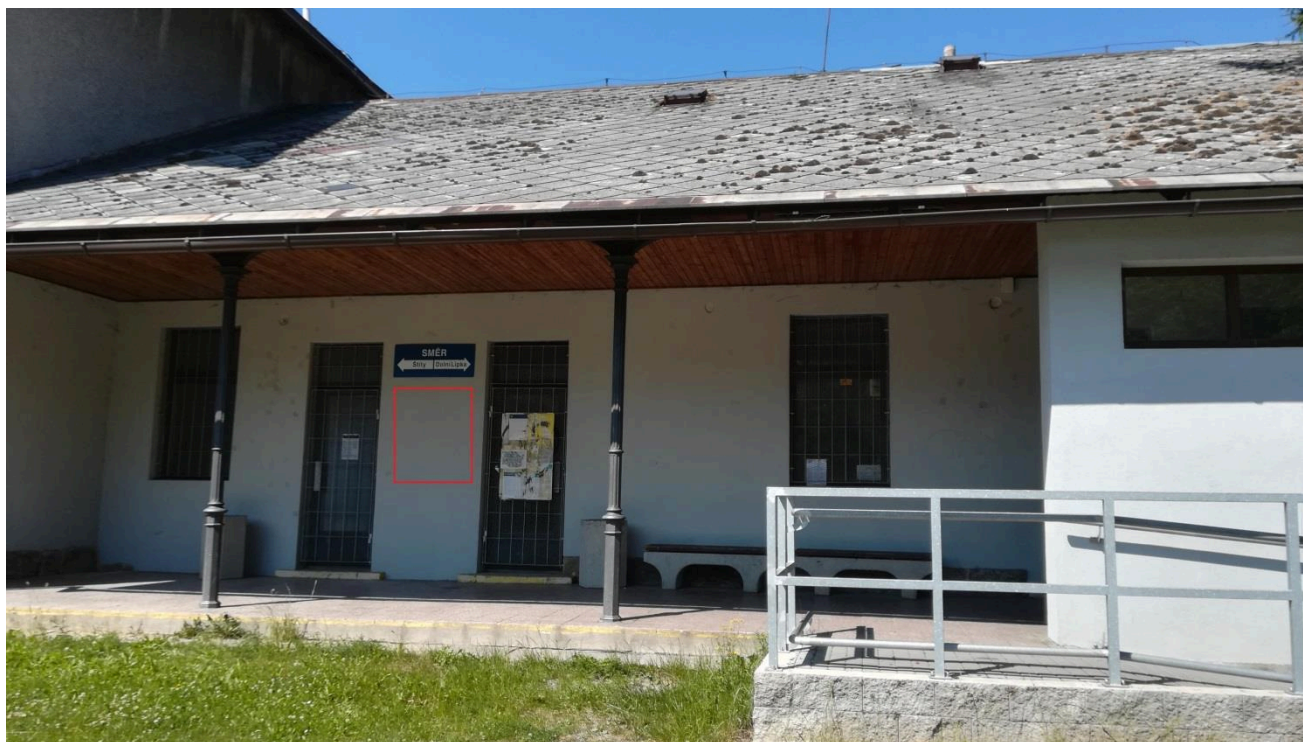
Výpravní budova žst. Červená Voda (nástupní prostory)