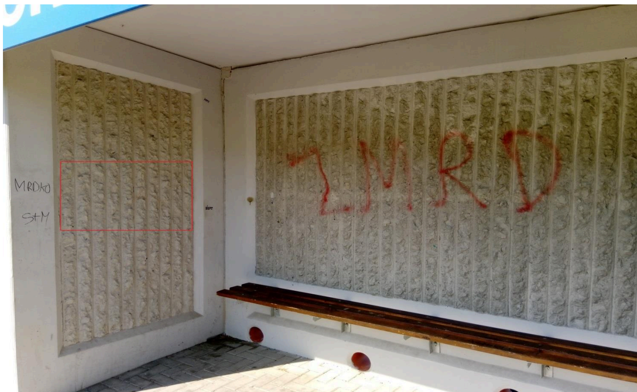
Zastávka Červená Voda, Pod Rozhlednou (přístřešek)