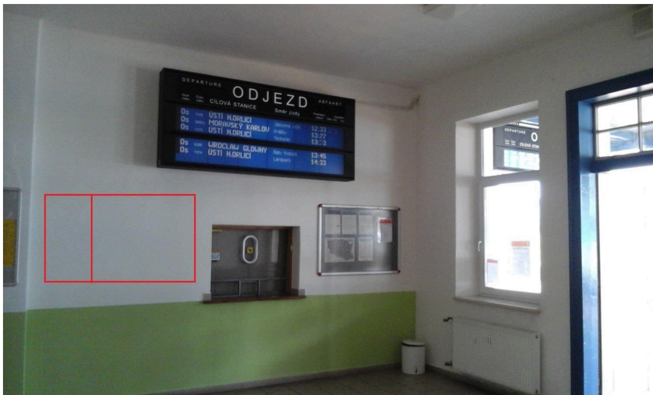
Výpravní budova žst. Lichkov (čekárna)