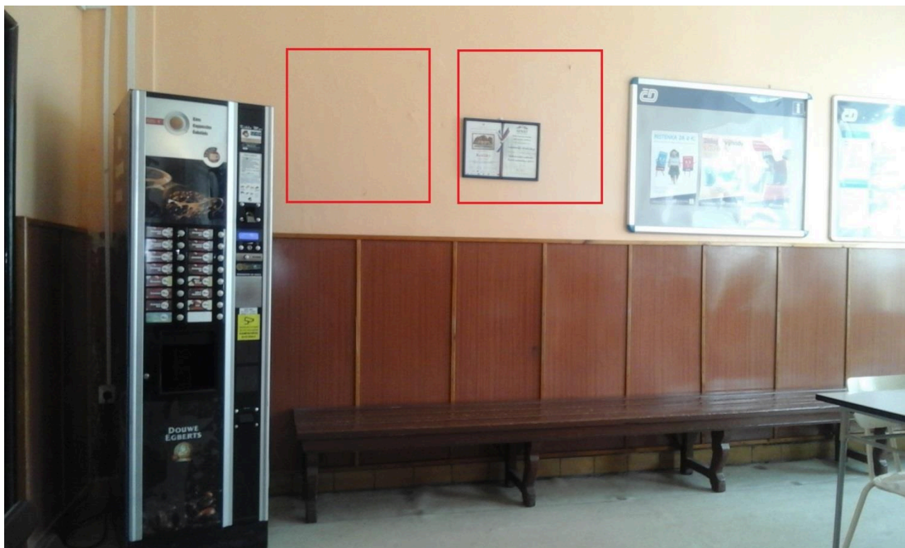
Výpravní budova žst. Králíky (čekárna)