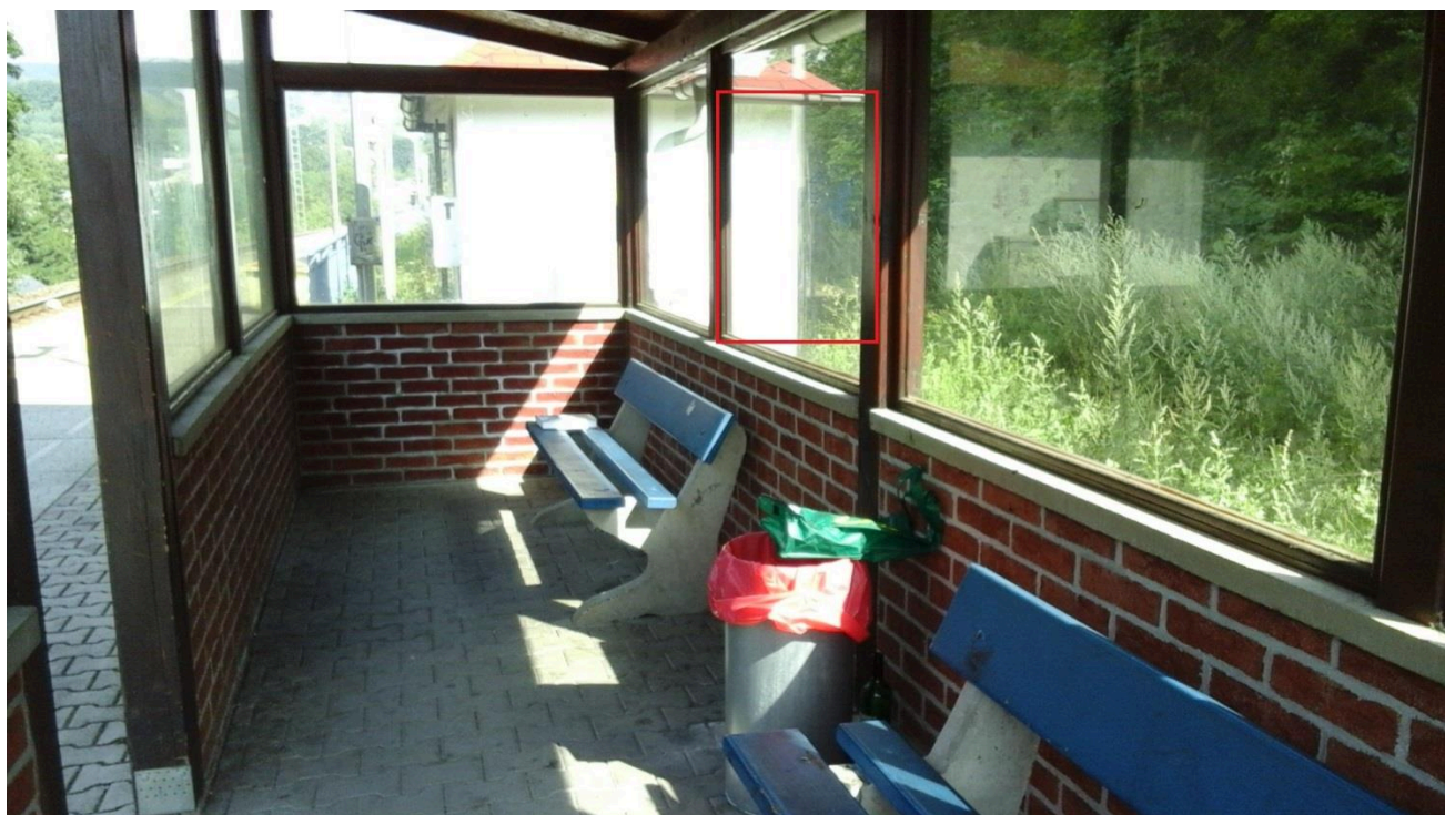
Zastávka Mladkov (přístřešek)