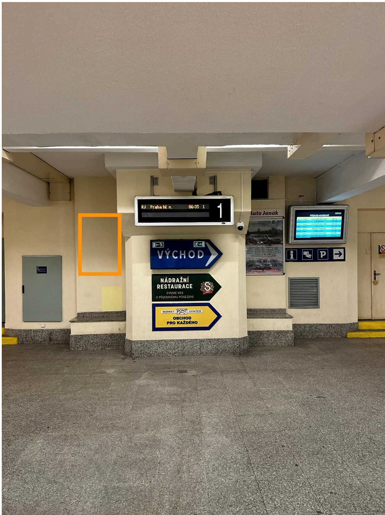
Výpravní budova žst. Česká Třebová (podchod)