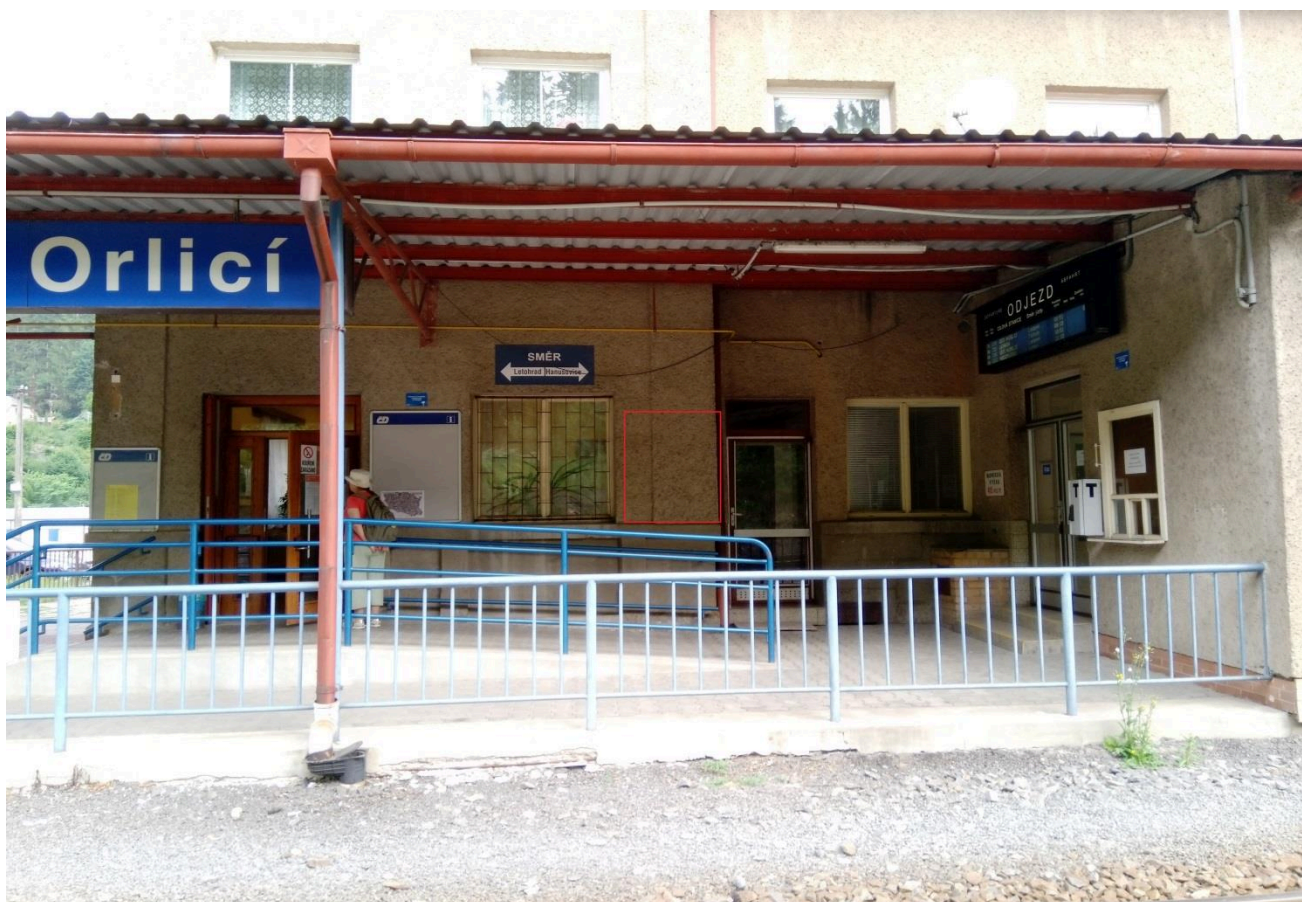
Výpravní budova žst. Jablonné nad Orlicí (nástupní prostory)