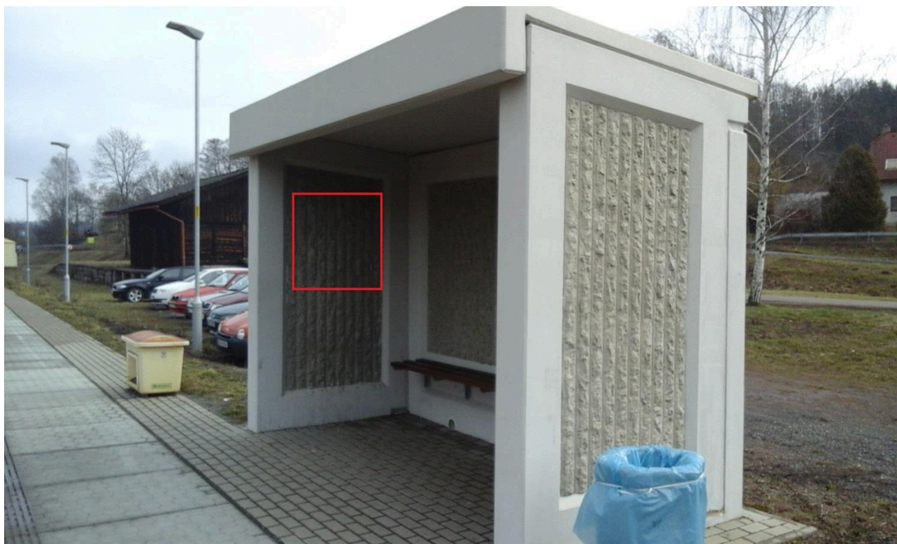
Žst. Dolní Dobrouč (přístřešek)