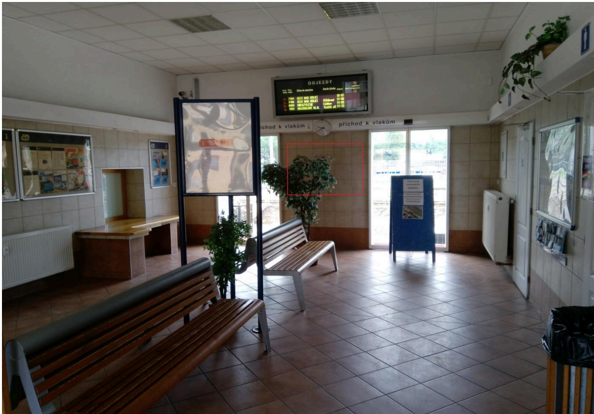
Výpravní budova žst. Letohrad (vestibul)