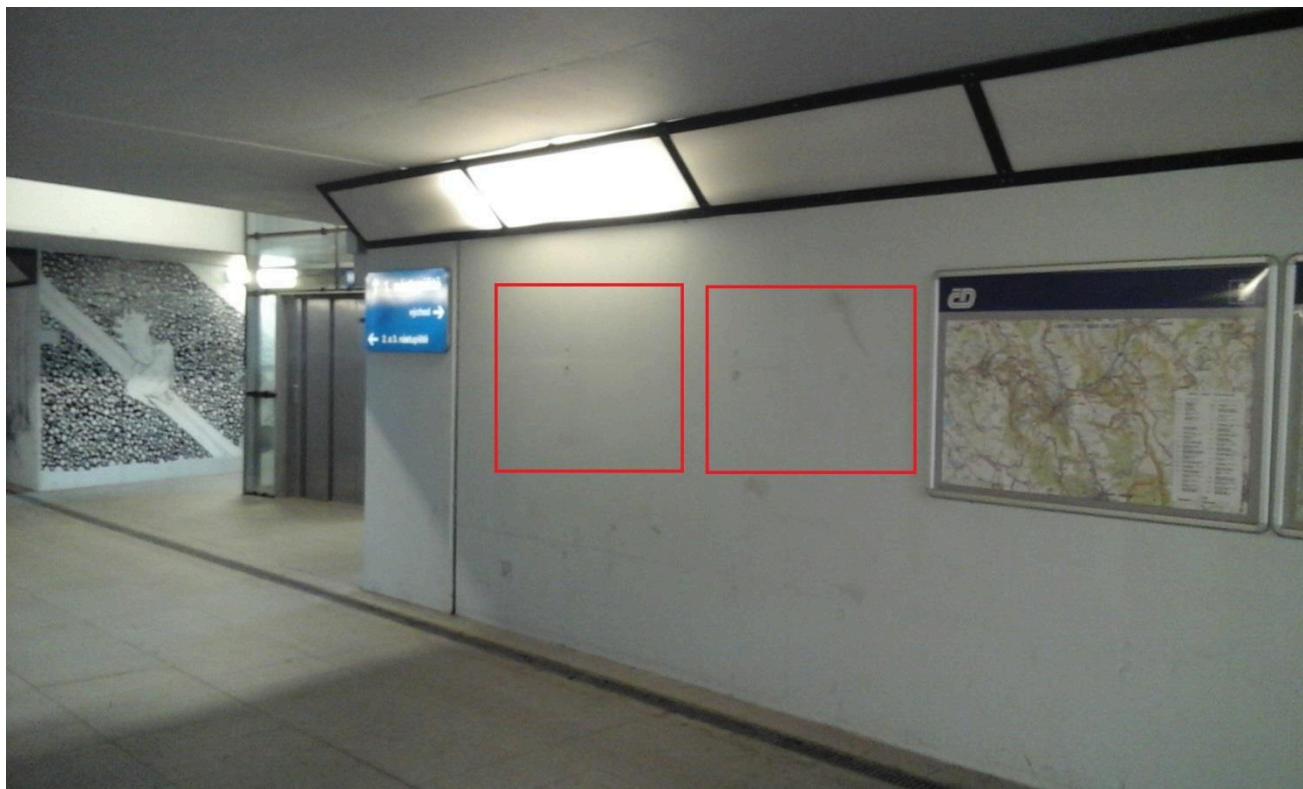
Výpravní budova žst. Ústí nad Orlicí (podchod) 3