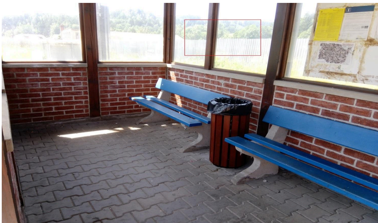
Zastávka Jamné nad Orlicí (přístřešek)