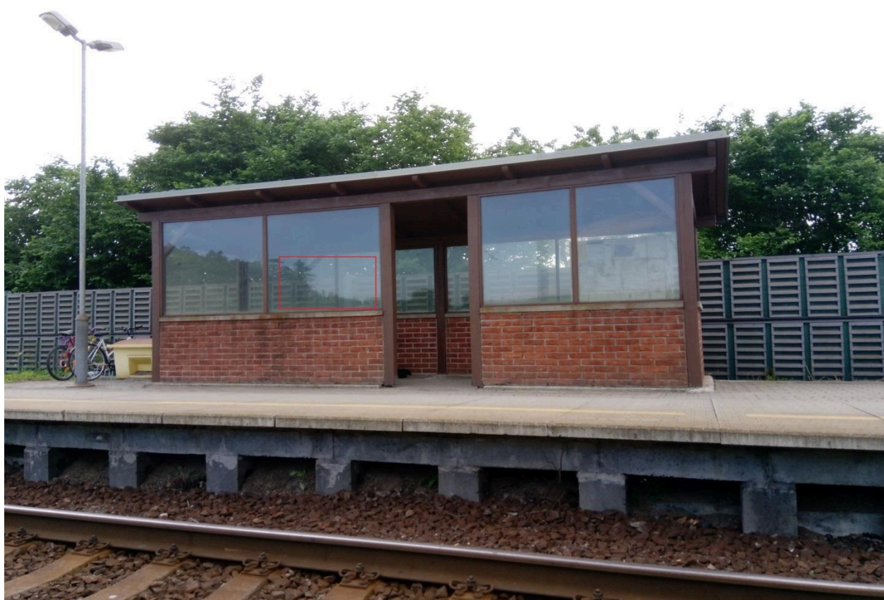
Zastávka Verměřovice (přístřešek)