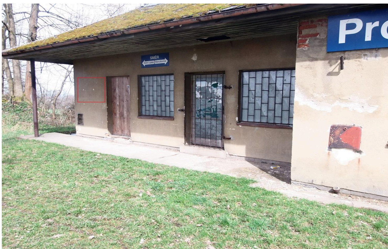
Zastávka Prostřední Lipka (nástupní prostory)