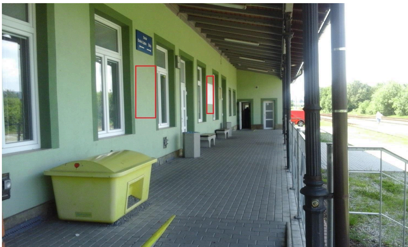
Výpravní budova žst. Králíky (nástupní prostory)