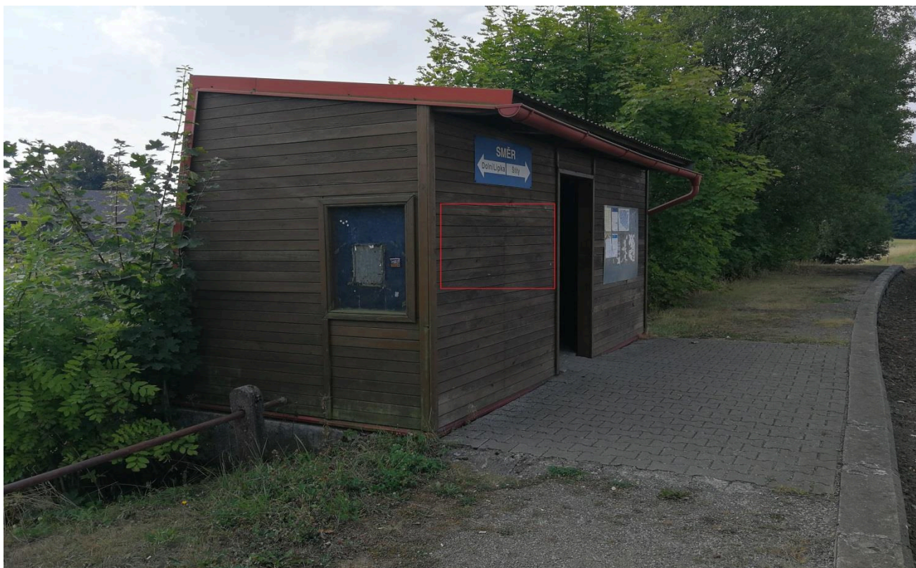
Zastávka Dolní Orlice (přístřešek)