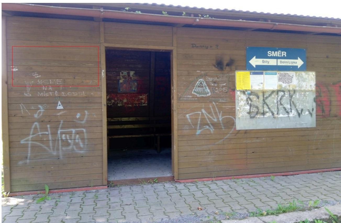
Zastávka Králíky (přístřešek)