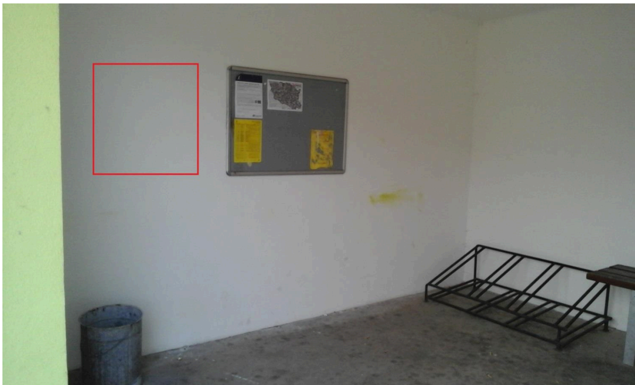
Zastávka Dolní Libchavy (přístřešek)