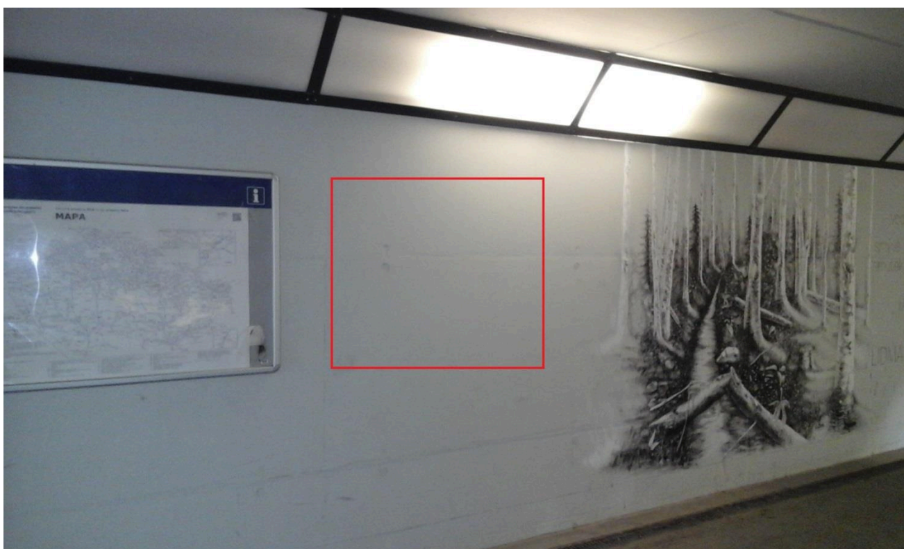
Výpravní budova žst. Ústí nad Orlicí (podchod) 2