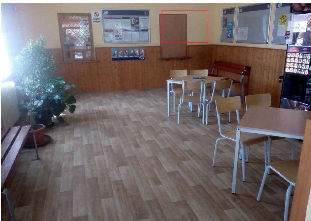
Výpravní budova žst. Jablonné nad Orlicí (čekárna)