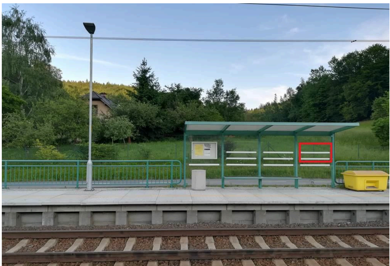
Žst. Lanšperk (přístřešek)