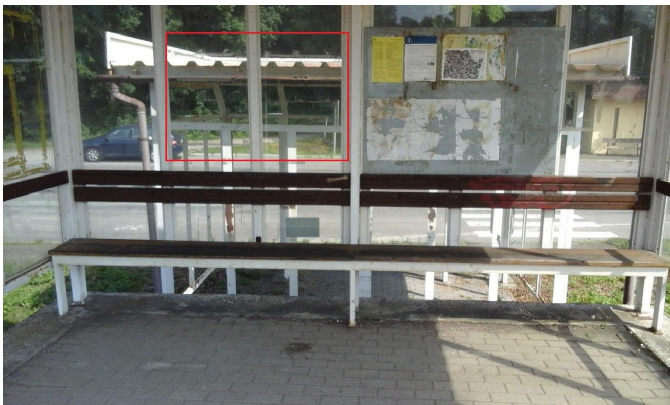
Zastávka Černovír (přístřešek)