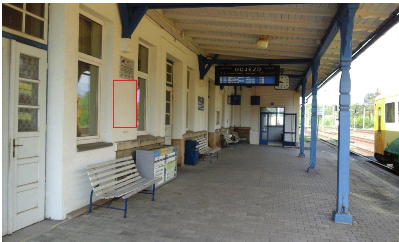
Výpravní budova žst. Lichkov (nástupní prostory)