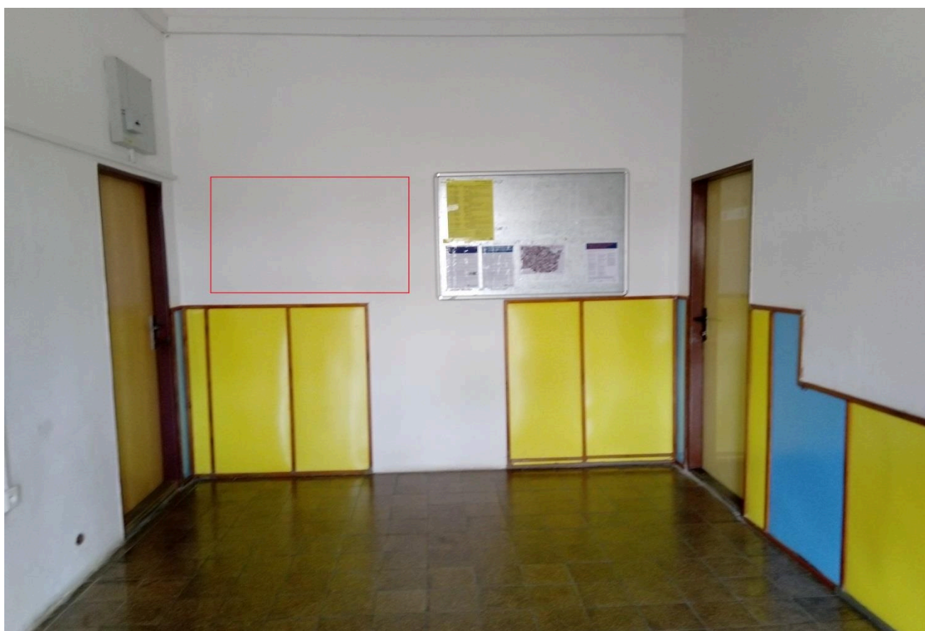
Výpravní budova žst. Dolní Lipka (čekárna)