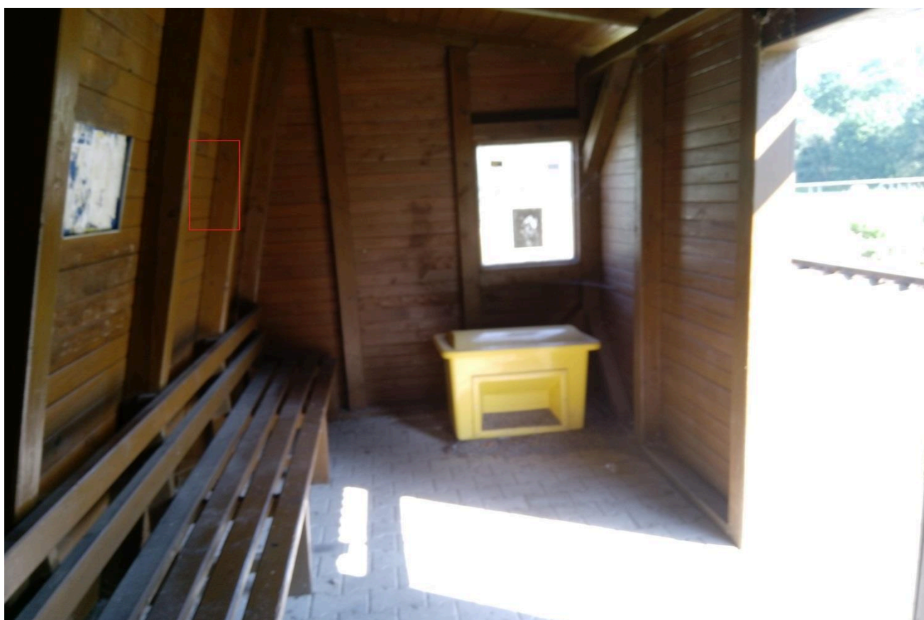
Zastávka Mlýnický Dvůr (přístřešek)