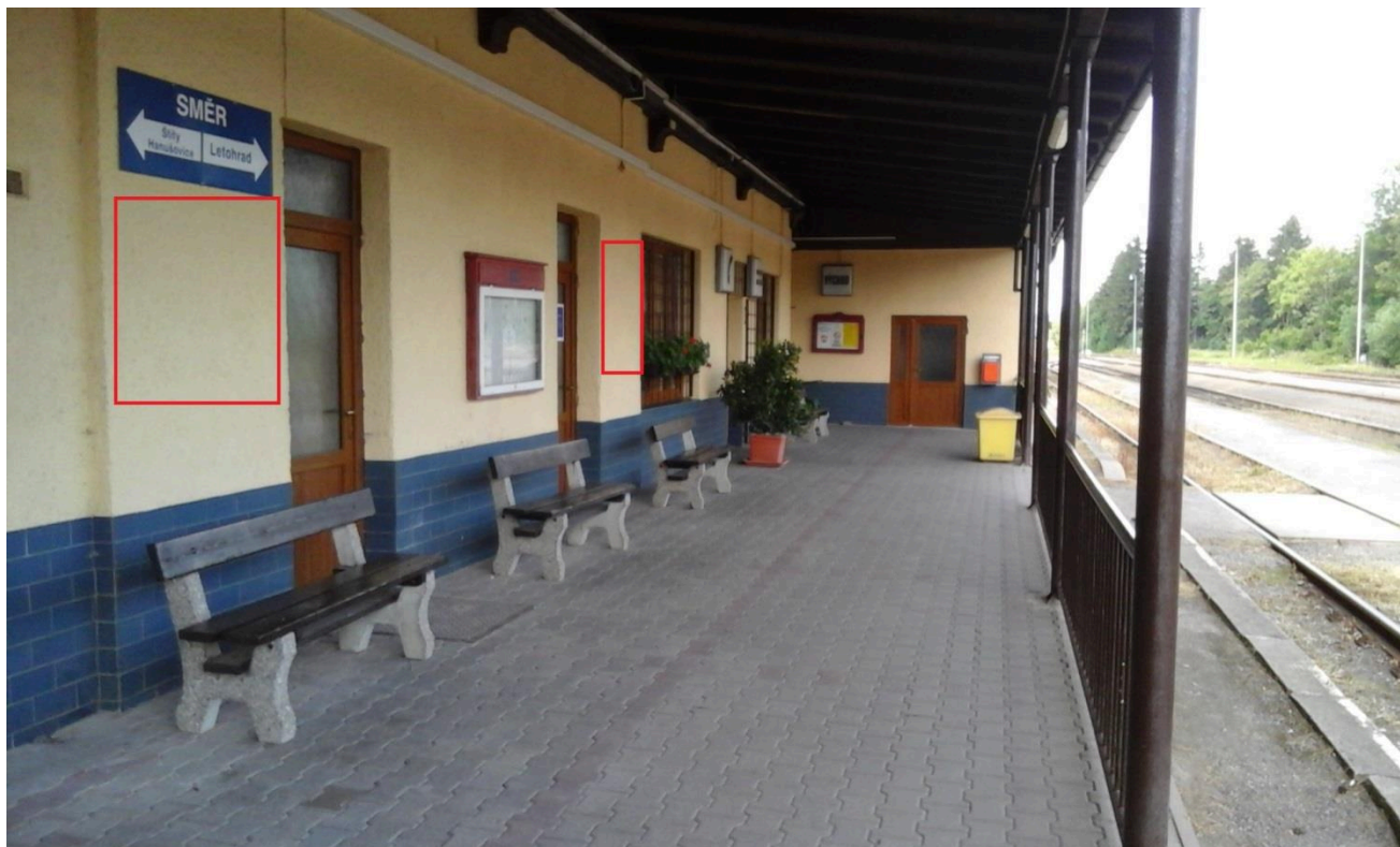
Výpravní budova žst. Dolní Lipka (nástupní prostory)