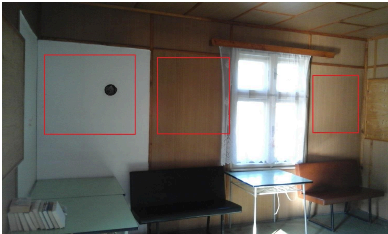
Výpravní budova žst. Lanšperk (čekárna) 2