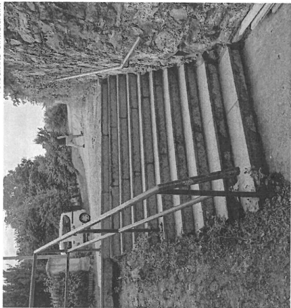
FOTOGRAFIE - STAVAJÍCÍ STAV