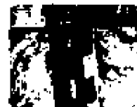
1. Detail zámku víka