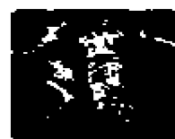
3. Detail zámku víka