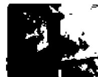
2. Detail zámku víka