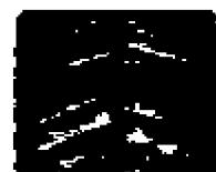
4. Detail zámku víka