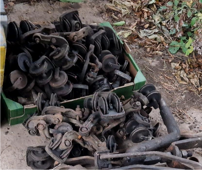
Světelné návěstidlo Se15 vyr. Elektrosignal Praha ze ŽST Bohosudov