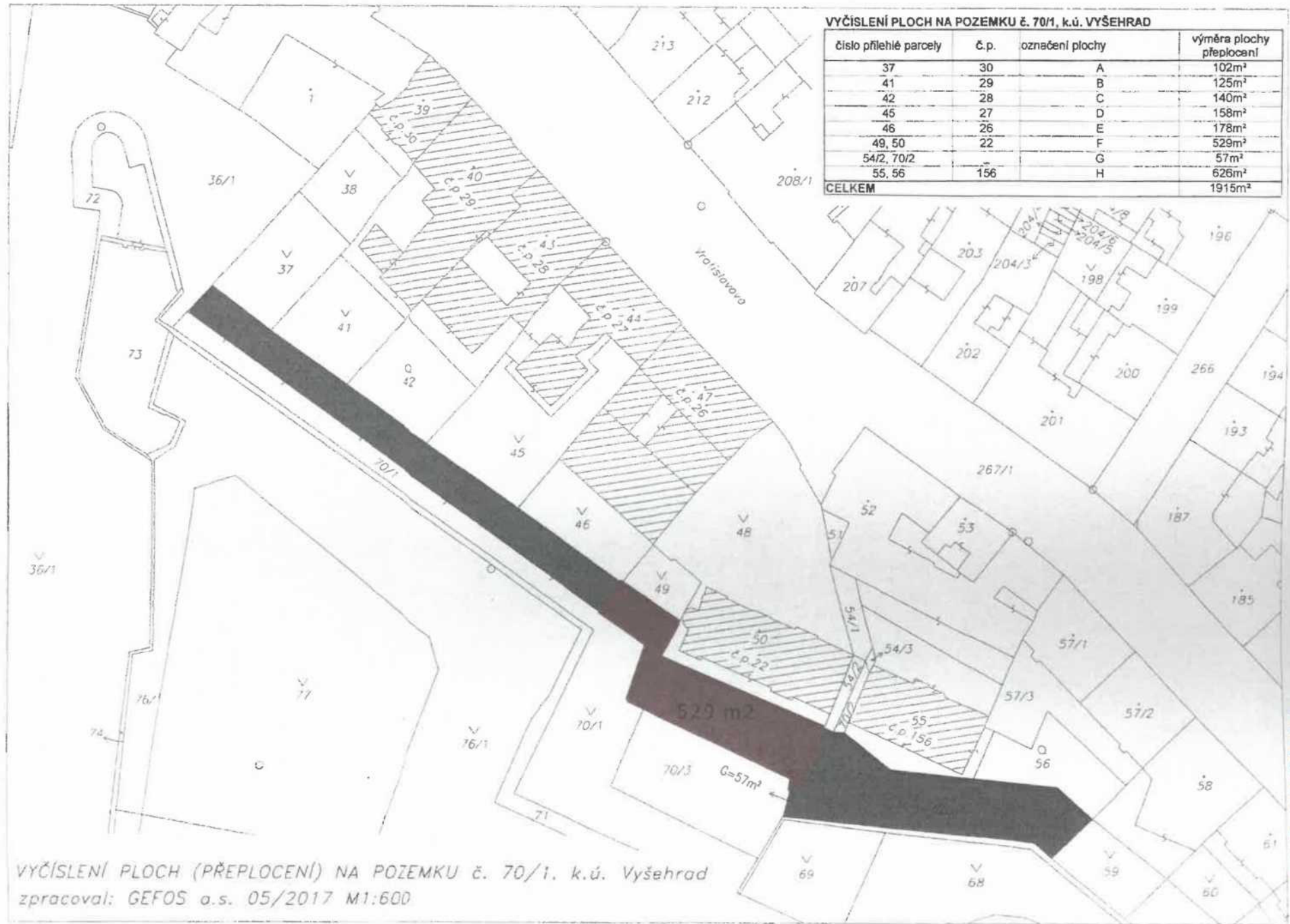
VYČÍSLENÍ PLOCH (PŘEPLOCENÍ) NA POZEMKU č. 70/1, k.ú. Vyšehrad zpracoval: GEFOS o.s. 05/2017 M1:600