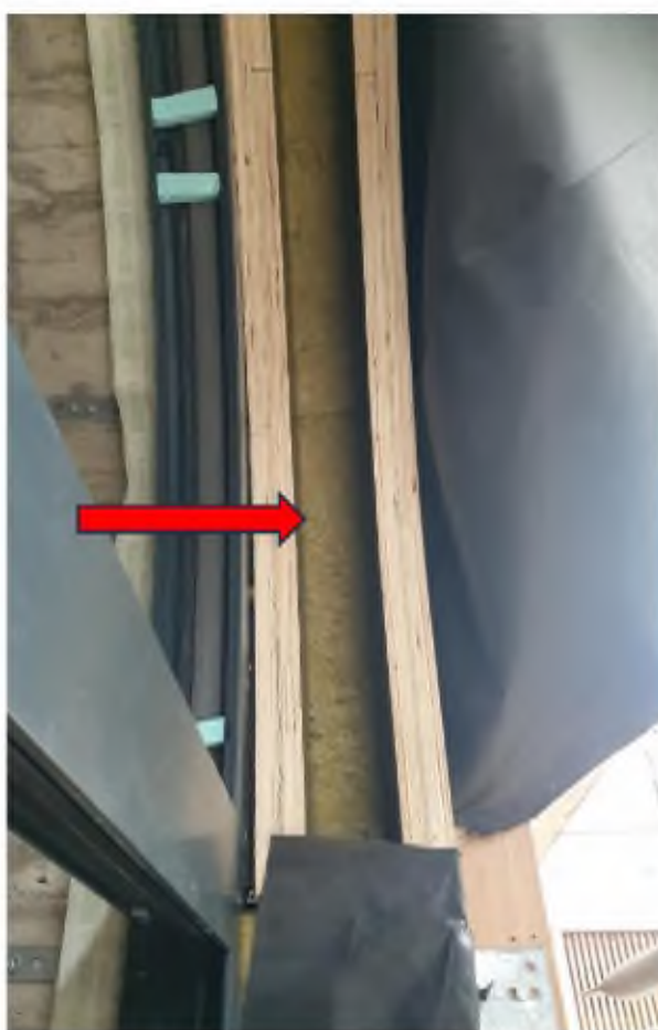
ZBV č. 6 – kruhová okna – kce pro ostění