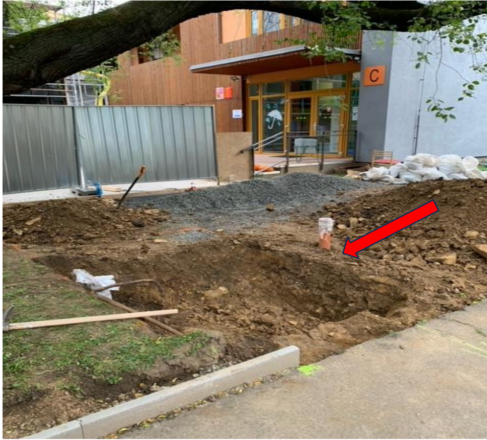
Oprava havarijního stavu splaškové kanalizace – vliv na termín plnění