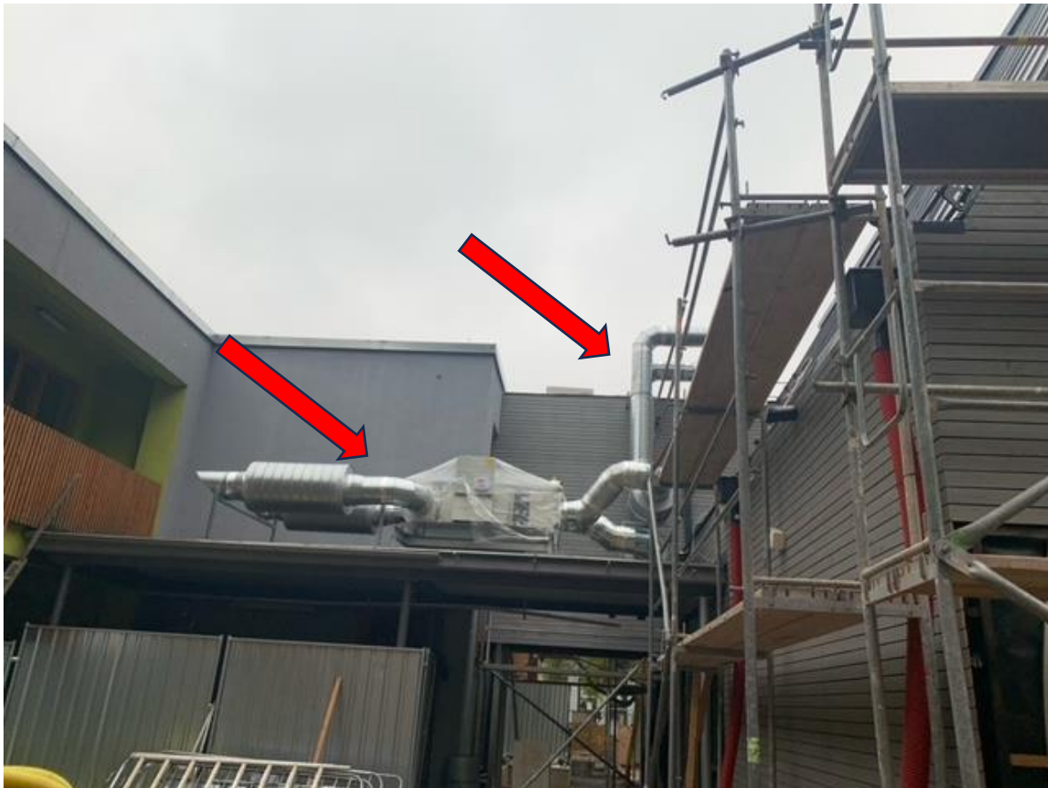
ZBV č. 11 – chybějící oplechování potrubí VZT