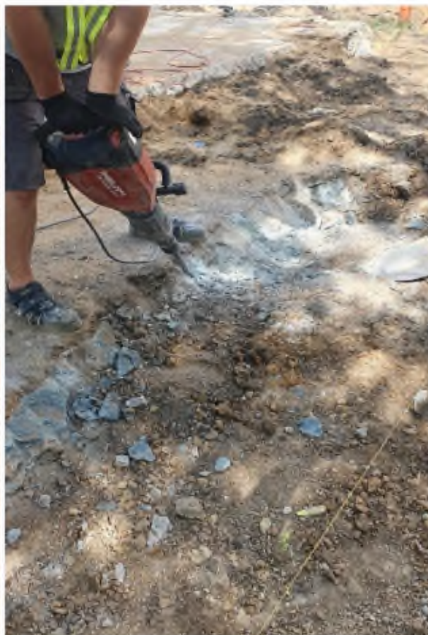
ZBV č. 1 - Úprava venkovní terasy