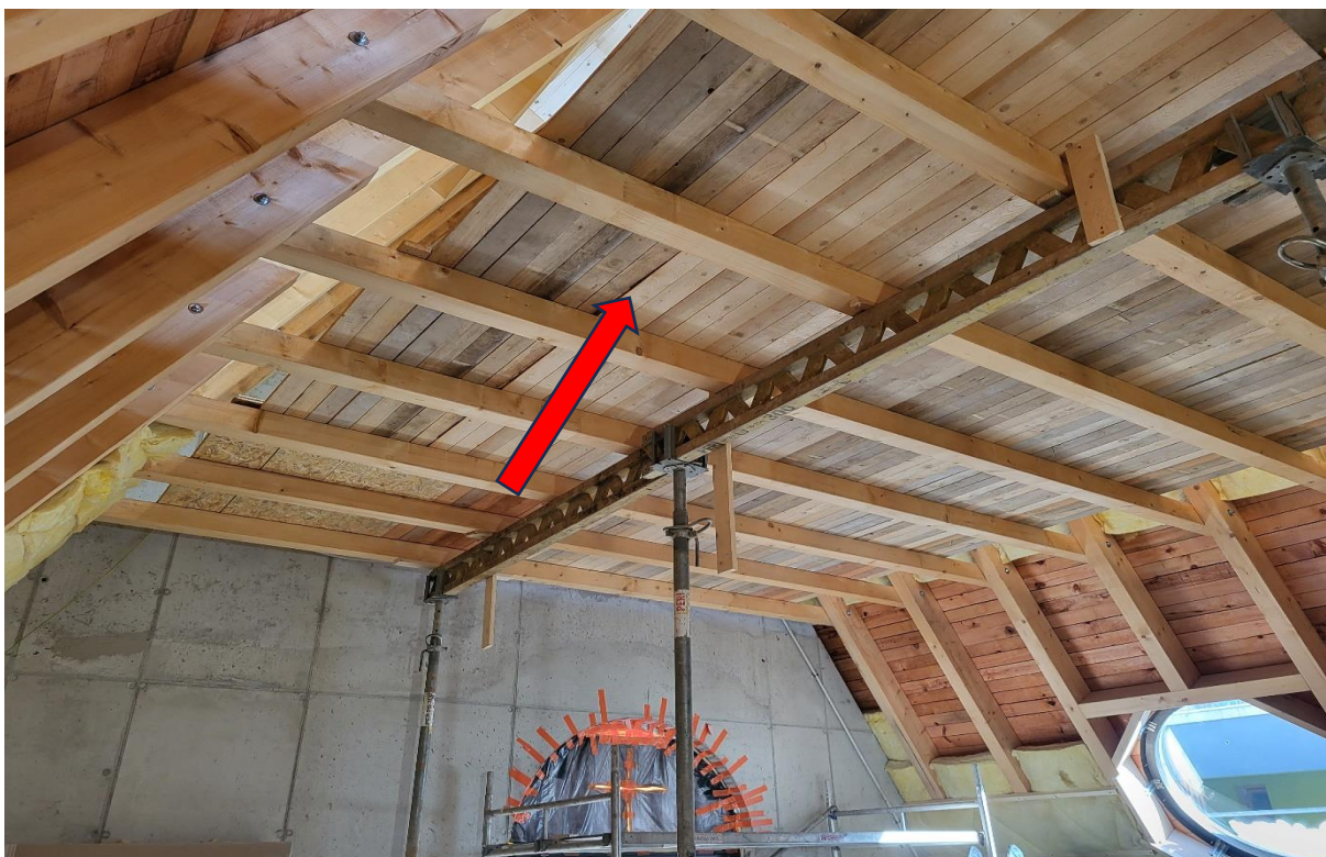
ZBV č. 9 – pracovní podlaha a podepření