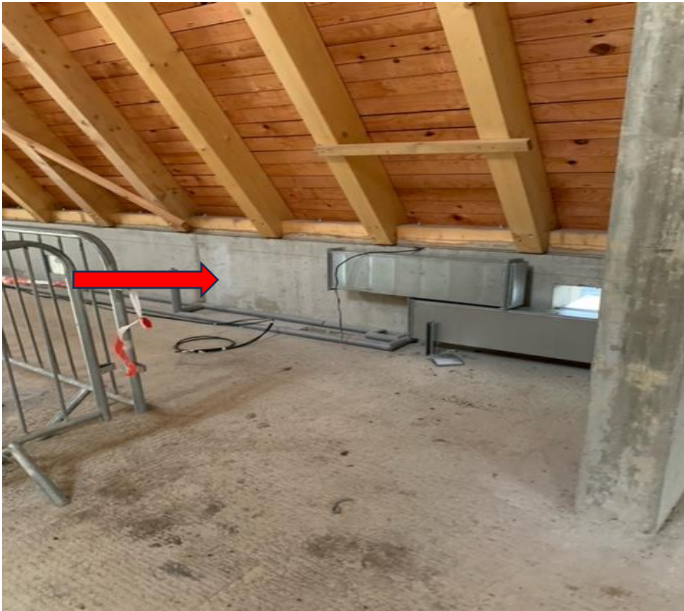
ZBV č. 10 – SDK předstěny a pohled