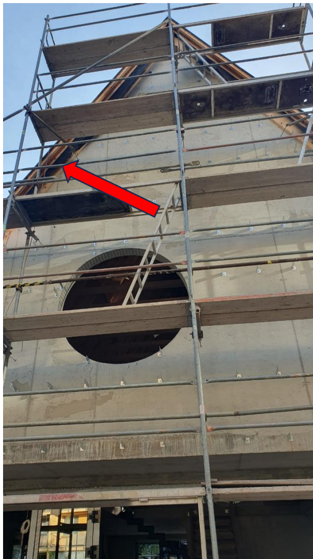
ZBV č. 3 – napojení střechy a fasády