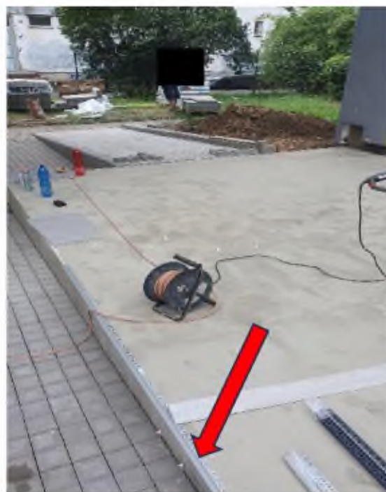
ZBV č. 1 - Úprava venkovní terasy