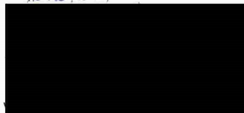
Řízení letového provozu České republiky, státní podnik (ŘLP ČR, s.p.)