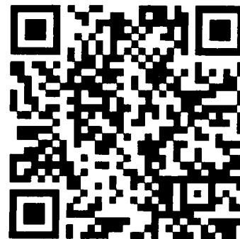
QR kód platebního příkazu