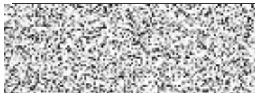
Milan Slavíček ředitel správy pojištění