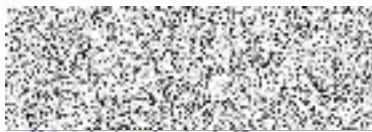
Mgr. Břetislav Hrdlička starosta města Strakonice