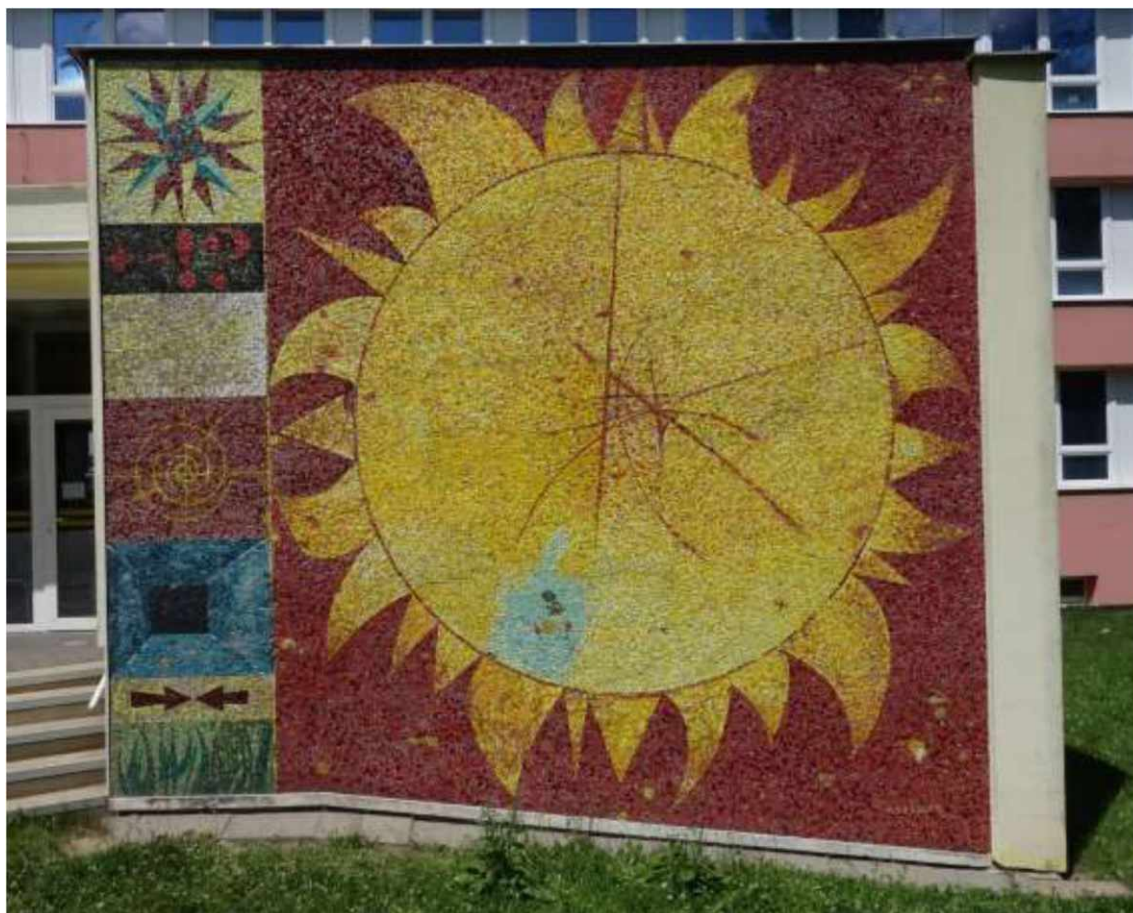
Celkový pohled na mozaiku „Slunce“ provedenou na fasádě základní školy ve Švermově ulici ve Žďáru nad Sázavou podle návrhu Mikuláše Medka. Stav v červnu 2022.