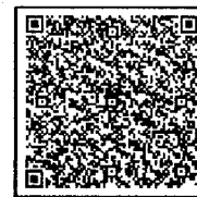
QR Platba + F