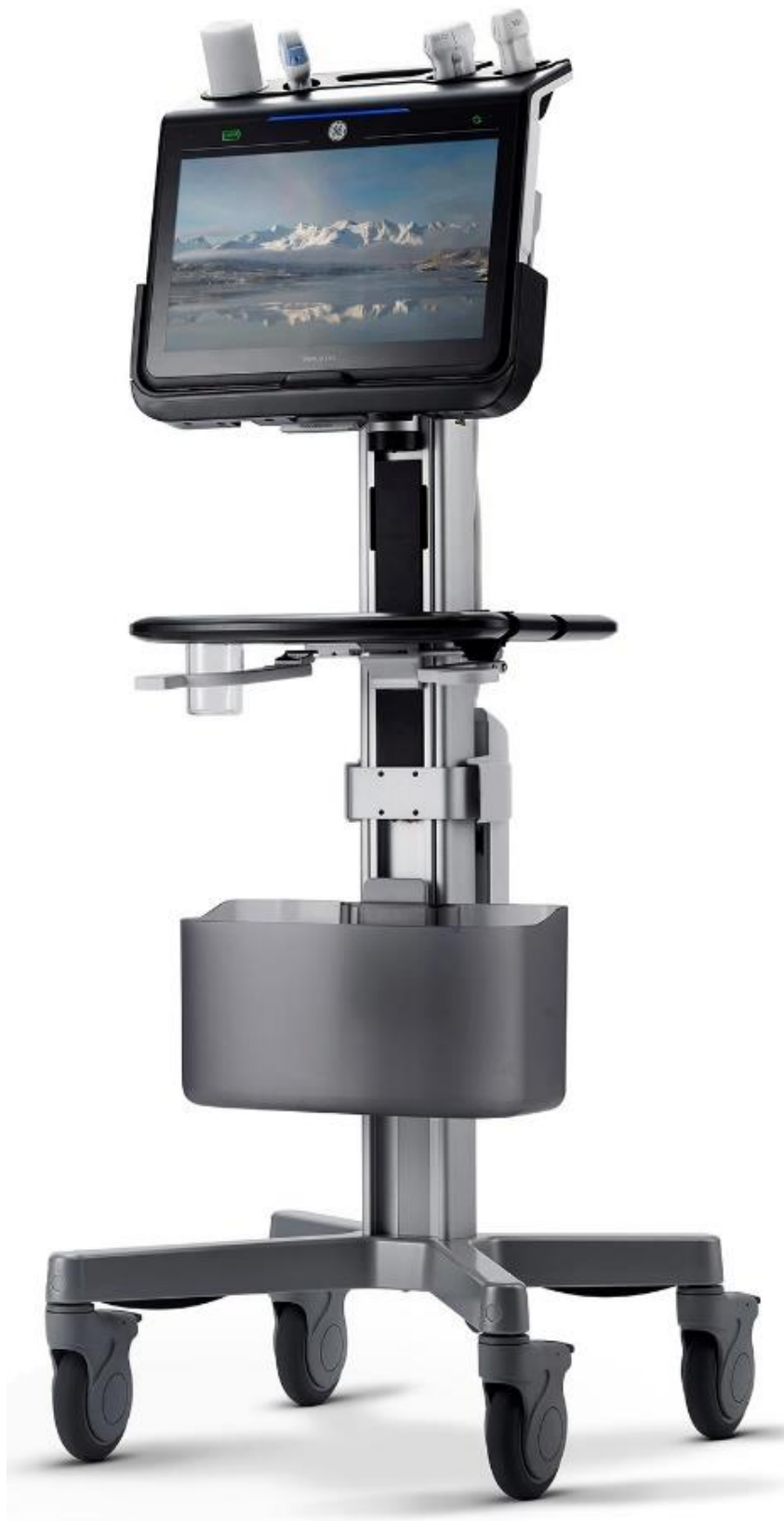
Venue Go s vozíkem