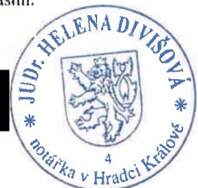
notářský kandidát pověřený notářem