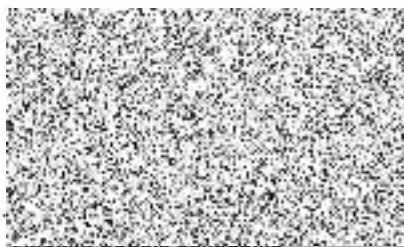
Razítko podpisu zákazníka