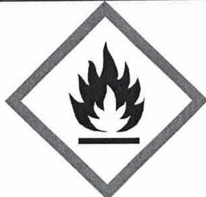
HP 3 Hořlavé