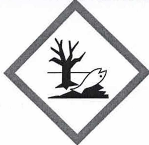
HP 14 Ekotoxický