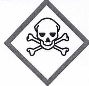
HP 6 Akutní toxicita

Odborný léčebný ústav Paseka, p.o. Paseka 145, 783 97