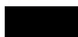
předseda Svaz měst a obcí Jihočeského kraje