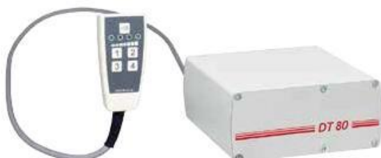
podtlaková jednotka DT80