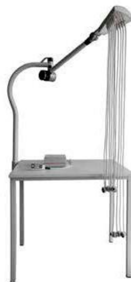
DT80 C – provedení na stůl s ramenem C