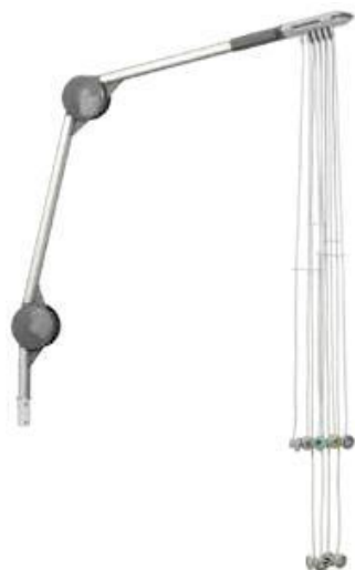
rameno standard B