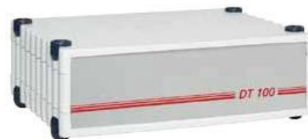
podtlaková jednotka DT100