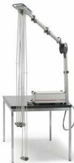
DT100T – provedení na stůl s teleskopickým ramenem