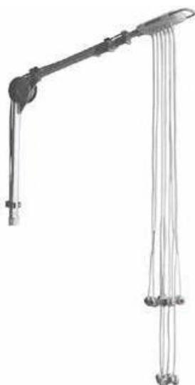
teleskopické rameno T