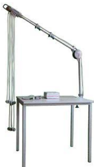
DT80 T – provedení na stůl s teleskopickým ramenem T