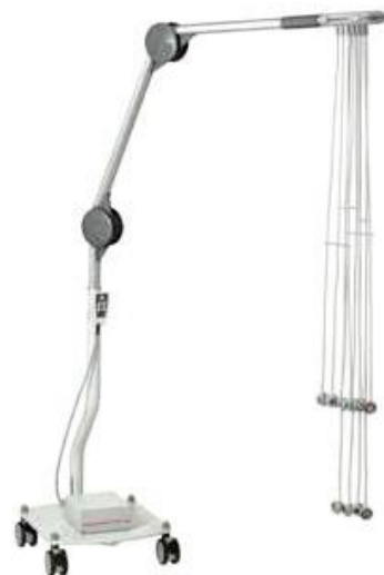
DT80 B plus – provedení s pojížděným stojanem a vícekloubovým ramenem