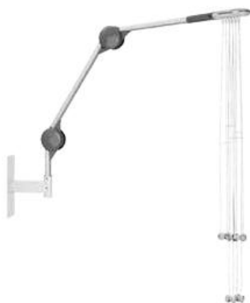
DT80 B / DT100 B – montáž vícekloubového ramene B na zeď