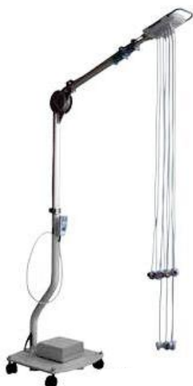
DT80T plus – provedení s pojížděným stojanem a teleskopickým ramenem

Předností systému je bezpečné upevnění elektrod, zejména při ergometrii. Různé varianty provedení DT100 a DT80 splňují kompletní řadu požadavků a najdou své uplatnění v každodenní lékařské praxi.