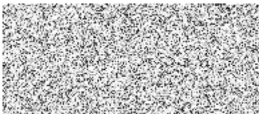
Domov mládeže a školní jídelna Pardubice ubytovatel