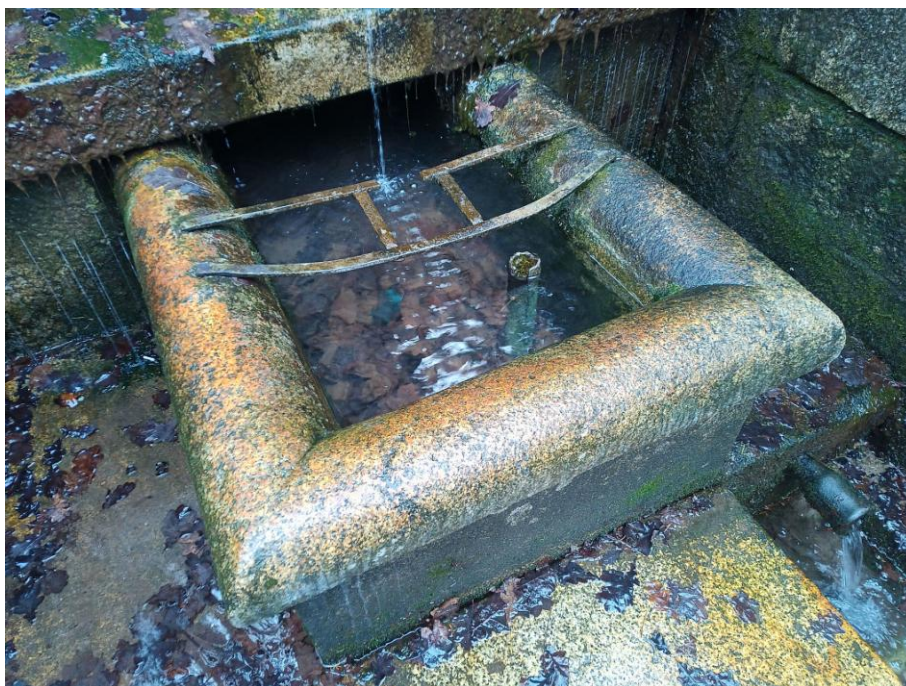
Foto 16 Žulová vana kašny a zprohýbané kované držáky na nádoby pro vodu. Masivní průsak vody skrz spodní část čelní zdi.