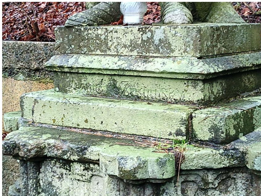
Foto 9 Přibetonované kamenné hranoly částečně zakrývají části plintu a dále zakrývají sekaný nápis „Věnuje v Zákoutský“. Dále pak tyto hranoly nejsou ani nějak pečlivě sesazeny. Pravděpodobně se jedná o druhotný zásah, provedený z prozatím neznámých důvodů.