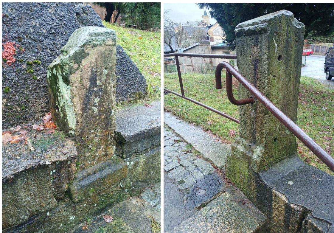
Foto 14, 15 Sloupky při vstupu ke kašně, u jednoho chybí celá vrchní část.