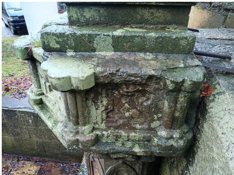
Foto 10,11,12 Množství defektů, plastických vysprávek a kamenných plomb v horní římse pilíře.