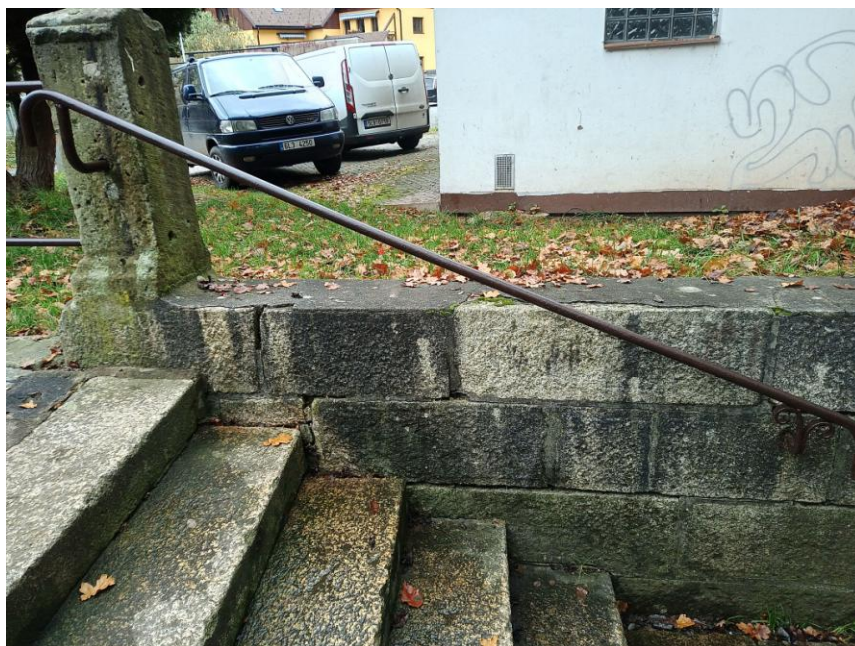
Foto 13 Foto současného zábradlí, původní zůstala pouze spodní konzole.