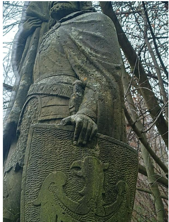
Foto 3,4 Socha sv. Václava a detaily poškození, palec levé ruky a další defekty povrchů.