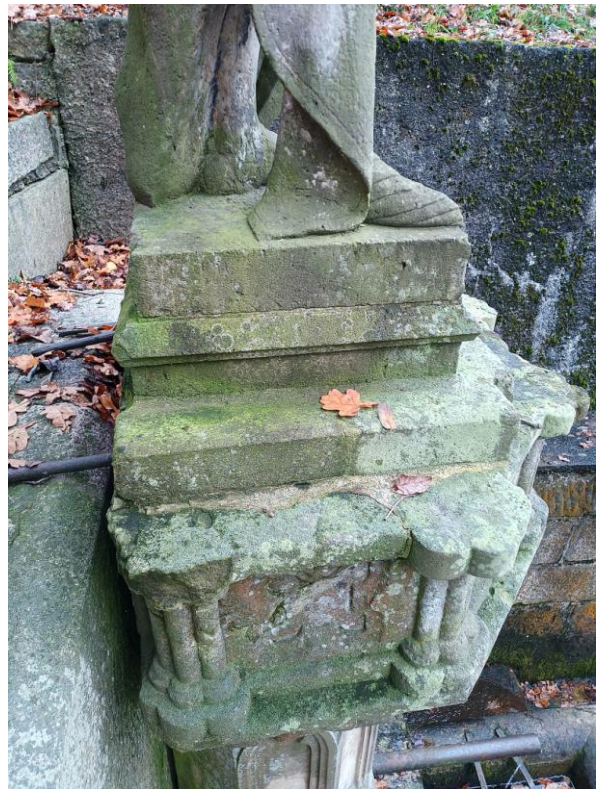
Foto 7, 8 Způsob kotvení ocelových kramlí do betonových výplní v zadní části římsy, defekty a praskliny v dekorativních částech.