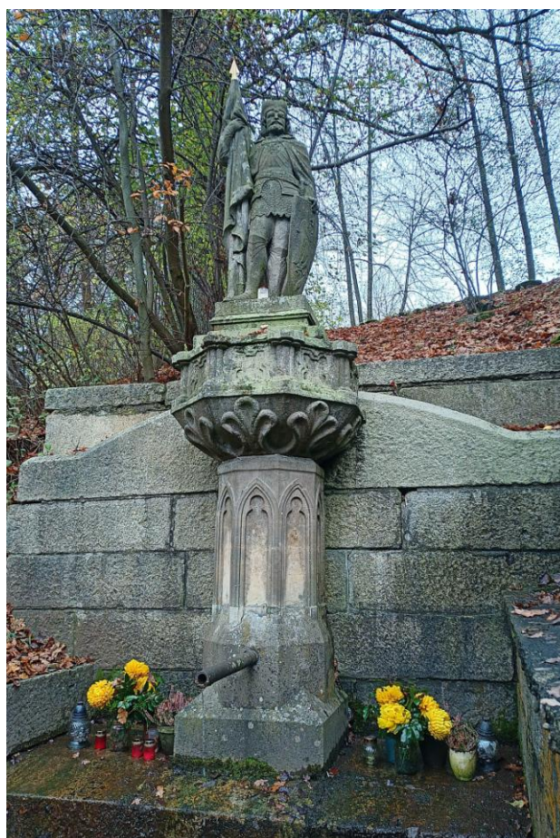
Foto 2 Socha, pilíř a stěny jsou pokryty biologickými činiteli a silně fixovanými prachovými depozity. Degradace originálu především ve srážkových stínech a v méně kvalitních partiích pískovce.