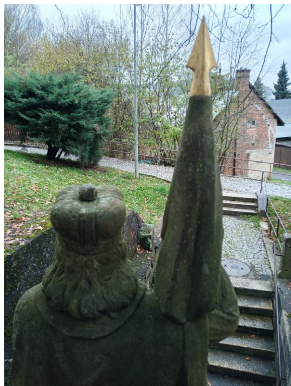
Foto 5, 6 Defekty v obličeji světce. Ve vrcholu knížecí čapky je umístěna betonová kulička, která bude nahrazena kamennou a kovaným křížkem.