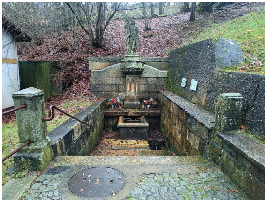
Foto 1 Kašna sv. Václava, celkový pohled