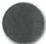
C37 noční modrá