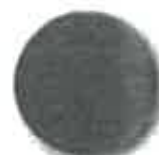
C36 tmavě červená