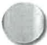
C33 světle fialová