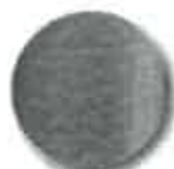
C35 světle zelená