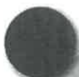
C39 tmavě zelená