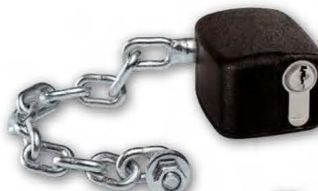
28832 KONTI 12 23401 KONTI PRO 12 57702 KONTI TECH 12