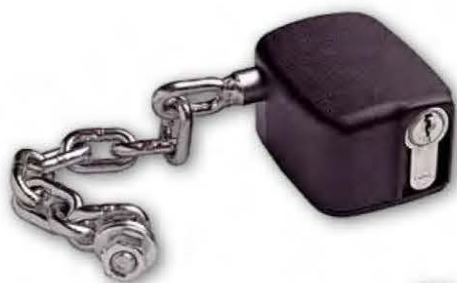
28831 KONTI 9 23411 KONTI PRO 9 57701 KONTI TECH 9